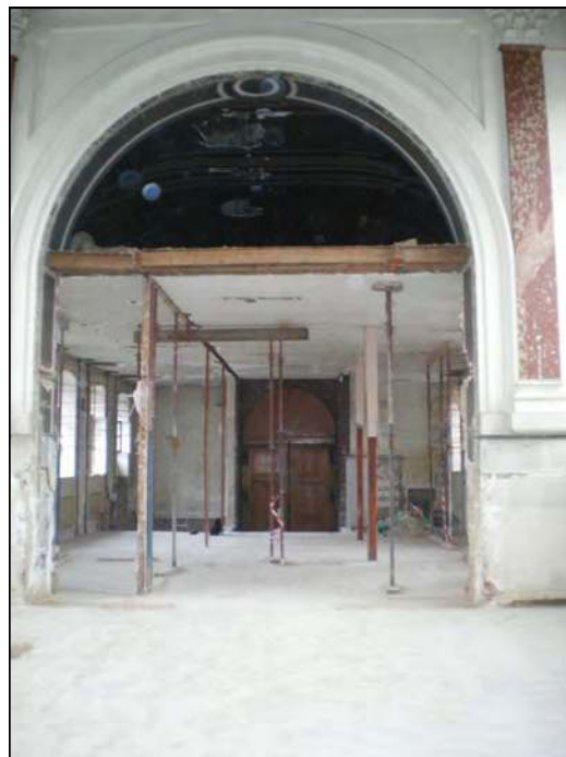
Amiens (80) : la future chapelle

Bien conscients, chers fidèles, que le salut d'une âme se prépare dès le berceau, nous luttons de toutes nos forces pour conserver les trésors du foyer chrétien, foyer de sainteté au milieu d'un monde décadent qui ne peut que conduire les âmes en enfer. Nous mesurons bien et nous partageons les soucis des pères et mères de famille qui ont compris que le salut des âmes de leurs enfants n'a pas de prix. Oui, il faut être prêt à tous les sacrifices des biens temporels – jusqu'à donner sa vie –, pour assurer l'éternité bienheureuse d'une âme.