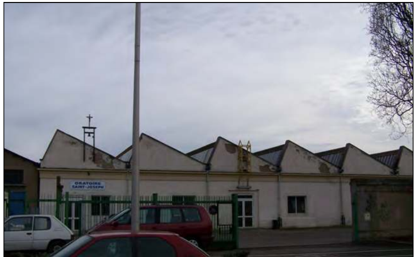
Travaux de toiture à l'Oratoire St-Joseph de Colmar (68)

2) Nous autres, créatures humaines, nous sommes composés d'une âme et d'un corps. Nous ne sommes sur la terre que pour un temps qui est bref, de