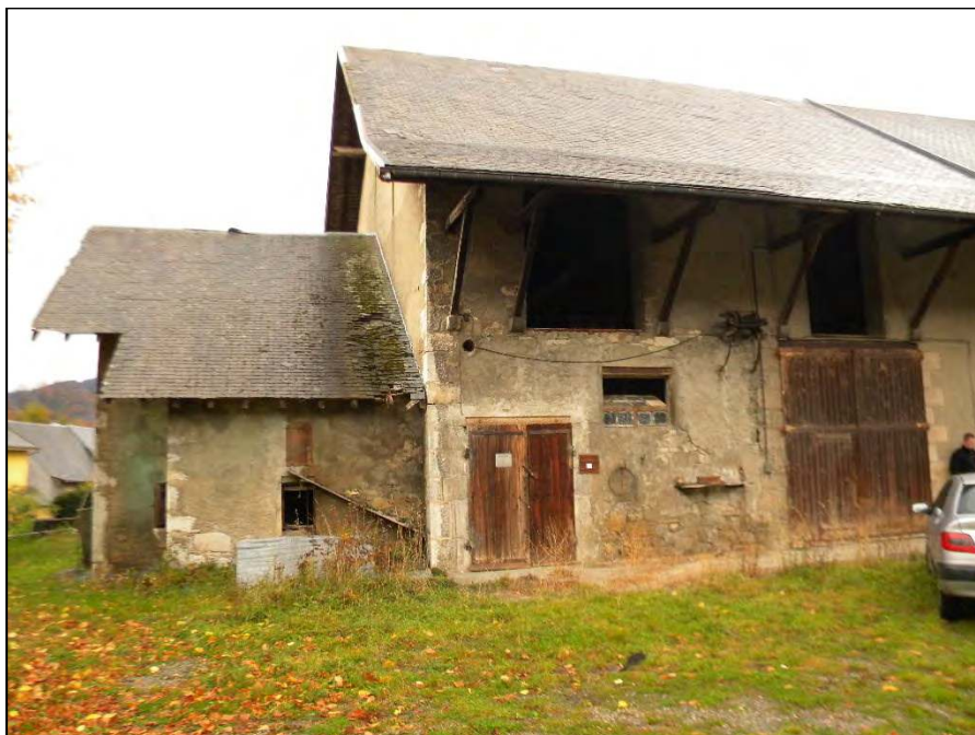
Future chapelle de Saint-Baldoph (73)

injustement méprisée et condamnée. Dans notre naïveté, nous ne pensions pas que le péché de Sodome pourrait un jour être placé sur le pavois, inscrit dans les codes des lois humaines. Comment est-il possible de s'être aveuglé jusqu'à ce point ? Comment ne pas mourir de honte d'avoir osé voter et inscrire une telle turpitude dans le marbre ? Si le monde continue et si la France survit, notre génération sera montrée du doigt pour avoir scellé l'infamie.