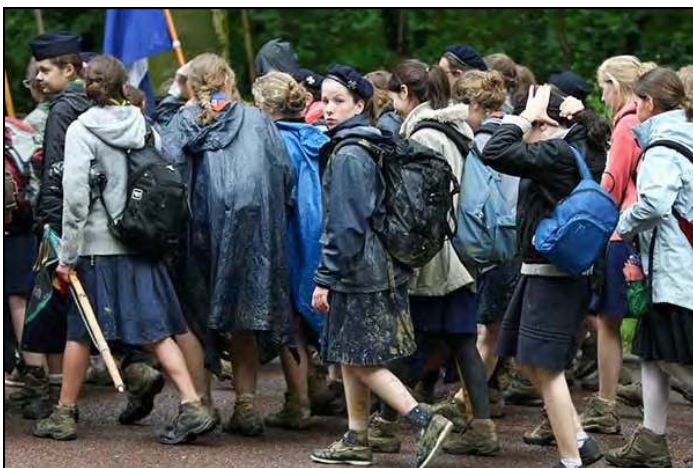
Pèlerinage de Chartres à Paris, Pentecôte 2013

Lorsque nous évoquons ces aujourd'hui difficiles et ces lendemains qui seront peut-être encore plus sombres, soyons en même temps certains que la grâce du bon Dieu ne nous manquera jamais et que les secours divins nous seront donnés tous les jours de notre vie pour cheminer jusque dans l'éternité