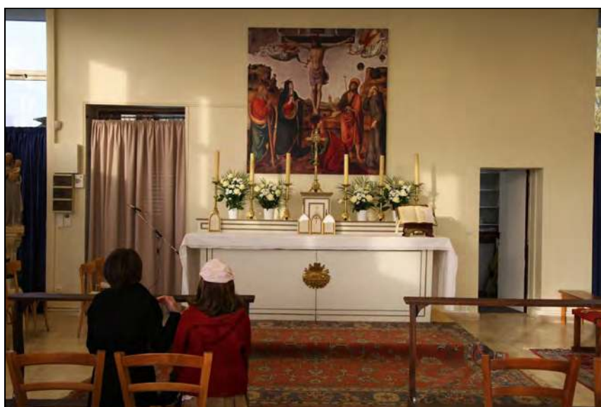
Chapelle Saint-Hubert, les Essarts-le-Roi (78)

Si nous le désirons pour notre patrie charnelle, nous l'espérons a fortiori pour la sainte Eglise. Toujours, Dieu a envoyé des saints, à des moments particulièrement dramatiques de son histoire, pour qu'elle continue sa mission de salut. Si les hommes vertueux de la terre n'abandonnent jamais leur