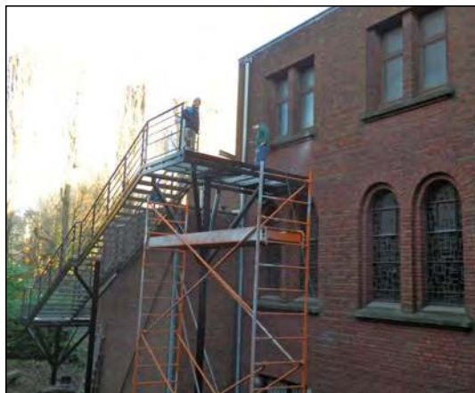
Prieuré de la Sainte-Croix : l'escalier de secours à Croix (59)

S'il est vrai que ces propos particulièrement indignes ont été, plus d'un mois après leur parution, retirés du site du Vatican, le père Federico Lombardi, porte-parole du Vatican, a pris le soin de nous préciser que l'entretien dont ces citations sont extraites était cependant « digne de foi dans son sens général » 5 ... Cette pensée du nouveau pape nous est d'ailleurs confirmée dans son Exhortation apostolique Evangelii Gaudium du 24 novembre 2013 où il nous exprime sa perspective fondamentalement évolutionniste de la vérité et des formules pour la dire : « Il ne faut pas penser que l'annonce évangélique doit se transmettre toujours par des formules déterminées et figées, ou avec des paroles précises qui expriment un contenu absolument invariable. » 6 Le pape parle ici avec à peine plus de retenue, non plus du bien et du mal, mais du vrai et du faux. Si le contenu de l'annonce évangélique n'est pas invariable, c'est que le dogme catholique est susceptible d'évolution à travers le temps. Rien ne demeure et ce qui était vrai hier ne le sera plus demain. C'est au tempo du sentiment religieux qu'évolue la religion.