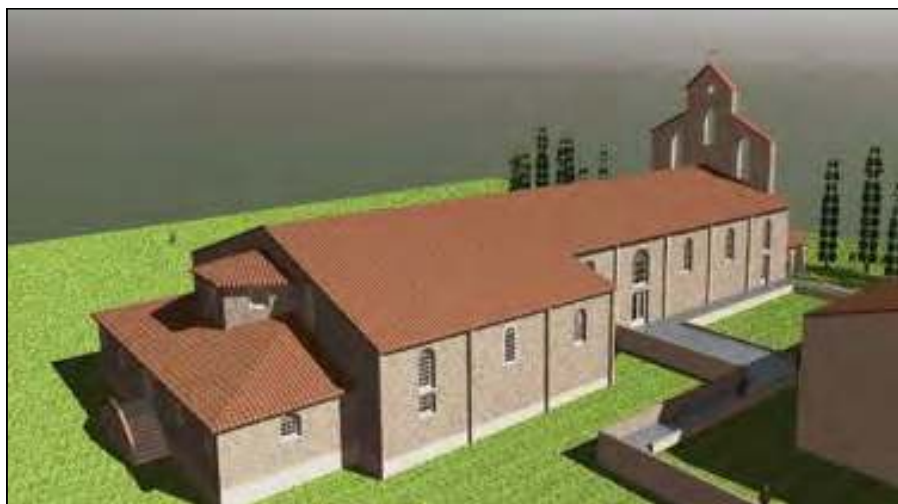
Future chapelle de l'école Saint-Joseph-des-Carmes (11)

La déclinaison de ces lois de mort qui ont suivi l'admission du divorce