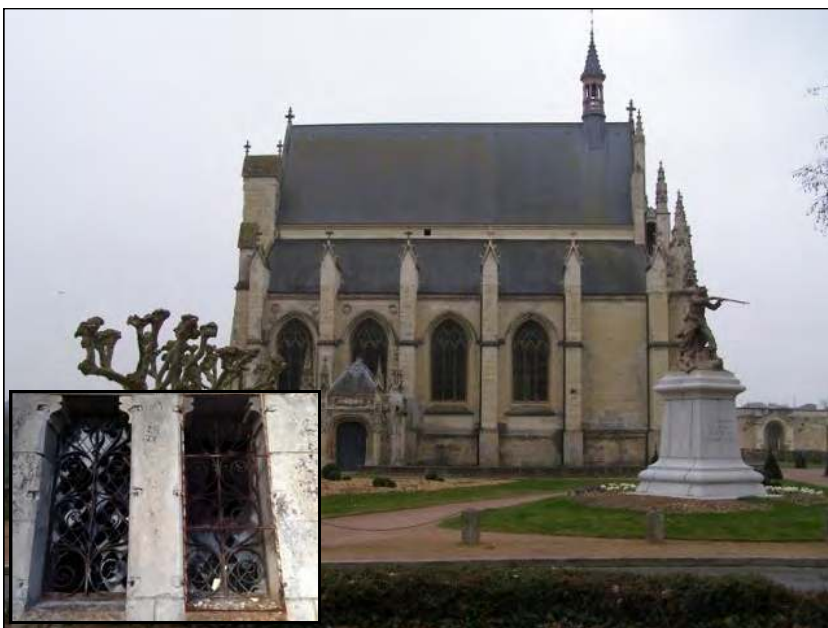
Collégiale Notre-Dame de Thouars (79)