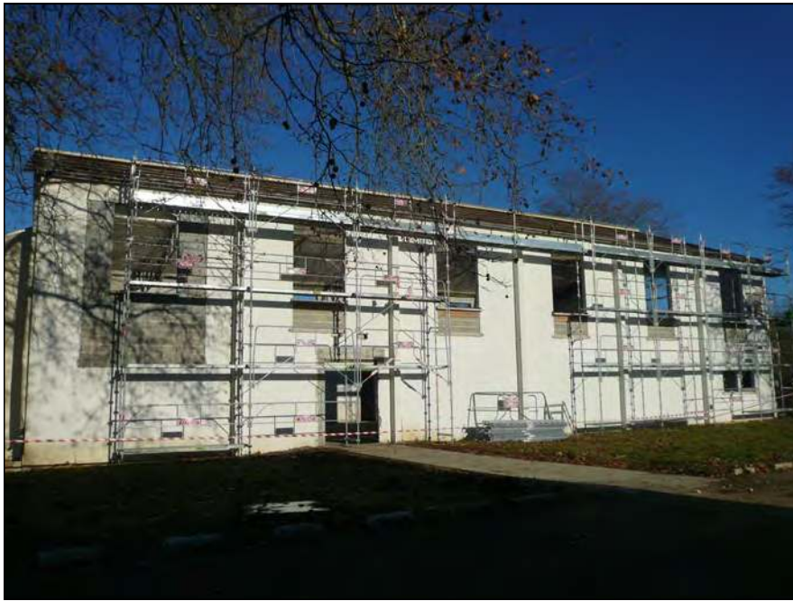
Future chapelle de la Martinerie (36)

18) Sous le regard de Notre-Seigneur Jésus-Christ et de la très sainte Vierge Marie reconnus et intronisés comme souverains du foyer, les parents catholiques doivent