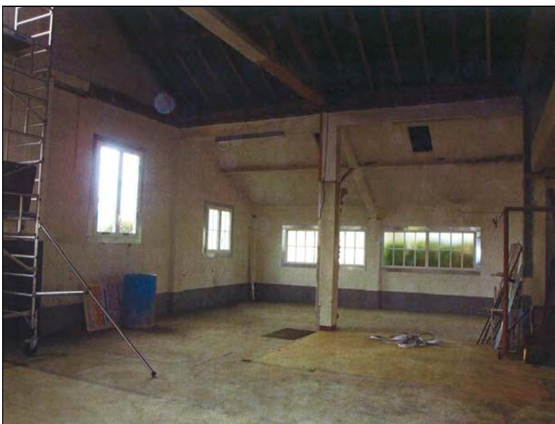
Travaux de la chapelle de Paray-le-Monial (71)

Mais en même temps, nous ne savons pas jusqu'où Dieu permettra que la partie humaine de l'Eglise se trouve endommagée et engloutie par la fureur de l'hérésie. Nous avons successivement vu tomber sous les coups des démolisseurs le dogme et la liturgie, le code et le catéchisme. Seules les conclusions de la morale catholique avaient jusqu'ici à peu près subsisté dans le langage pontifical. Si le monde rugissait encore contre l'Eglise, c'était justement parce qu'elle tenait encore une part de la morale. Mais au fait, pourquoi, depuis quelques mois, le monde ne gronde-t-il plus contre l'Eglise ? Que signifie ce répit ?