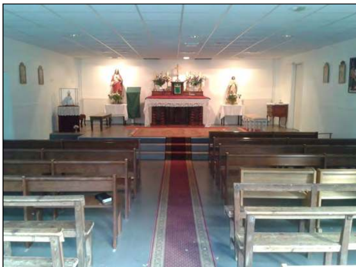
Chapelle de l'Enfant-Jésus à Bailly (78)

Notre vénéré fondateur y déclarait : « Je pense pouvoir dire que nous devons faire une croisade, appuyée sur le Saint Sacrifice de la messe, sur le Sang de Notre-Seigneur Jésus-Christ, appuyée sur ce roc invincible et sur cette source inépuisable de grâces qu'est le Saint Sacrifice de la messe. (...) Il nous faut faire une croisade, une croisade appuyée précisément sur cette notion de sacrifice, afin de recréer la chrétienté, refaire une chrétienté telle que l'Eglise la désire, l'a toujours faite avec les mêmes principes, le même sacrifice de la messe, les mêmes sacre-