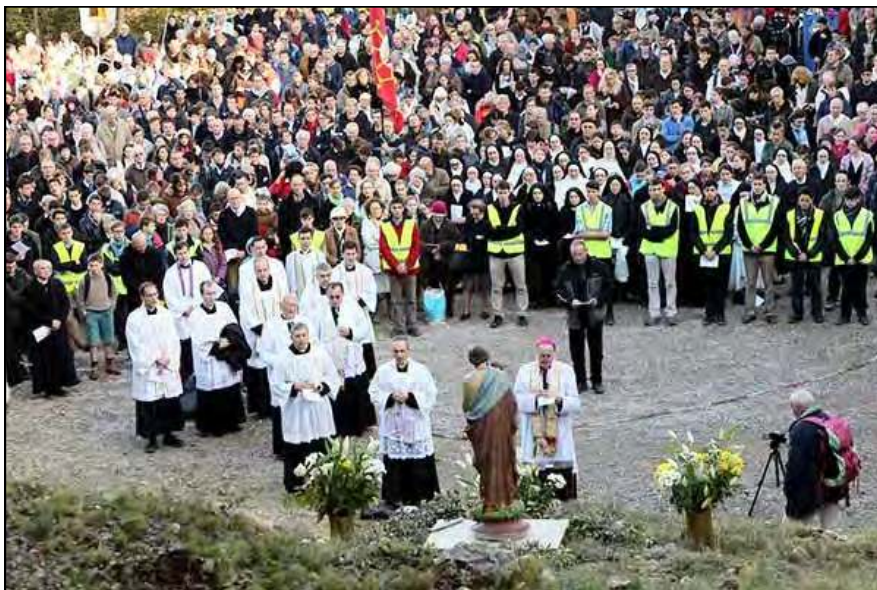
Consécration du district de France à saint Joseph, Cotignac (83), le 9 mars 2013

Nous voudrions faire le point sur ces deux appuis de l'espoir avant de rappeler quelques vérités qui balisent notre vie et précisent notre espérance. Acceptons de laisser de côté les impressions superficielles et trompeuses dont nos esprits sont peut-être encombrés. Il ne s'agit vraiment pas d'évoquer ici l'inclination naturelle des caractères des uns et des autres vers l'optimisme ou vers le pessimisme, mais de déterminer les motifs bons et sûrs dont nos cœurs doivent nourrir leur espérance.