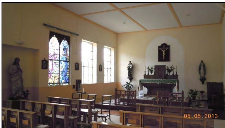
Chapelle du Sacré-Cœur, Cheniménil (88)

C'est sans doute l'ignorance de ce caractère satanique de la révolution dont nos esprits souffrent surtout. Nous avons pensé, selon l'idée que nous nous étions faite de l'histoire moderne, que la révolution ne mettait à bas un régime et