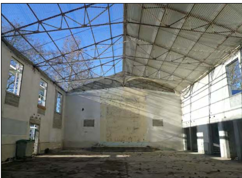
Future chapelle de l'école, la Martinerie (36)

Lorsque la révolution s'occupe de renverser les trônes et d'abattre les autels, de détruire les traditions et de ruiner le décalogue, de déboiser les so-