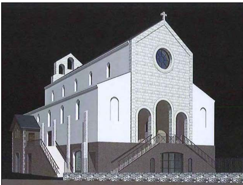
Projet de la future chapelle de Nantes (44)

le Synode fera œuvre de véritable miséricorde en rappelant, pour le