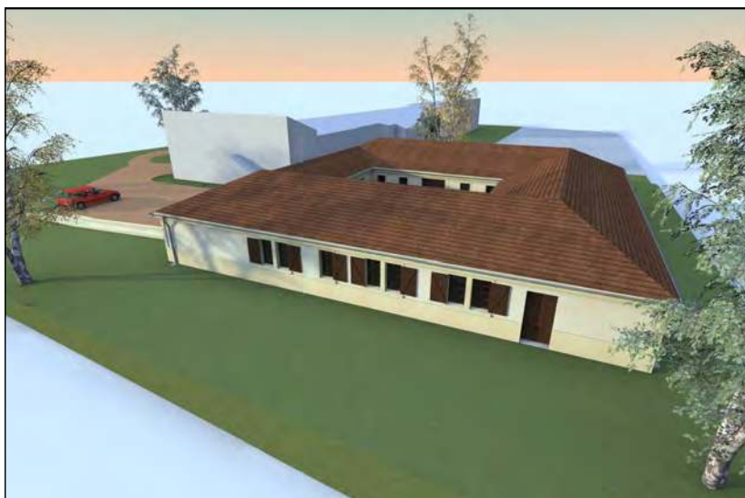
Projet du futur prieuré à Mantes-la-Jolie (78)

De nos jours, partout dans le monde, de nombreuses familles se sont mobilisées courageusement contre les lois civiles qui sapent la famille naturelle et chrétienne, et encouragent publiquement des comportements infâmes, contraires à la morale la plus élémentaire. L'Église peut-elle abandonner ceux qui, parfois à leur propre détriment, et toujours sous les moqueries et les quolibets, mènent ce combat nécessaire mais difficile ? Cela constituerait un contre-témoignage