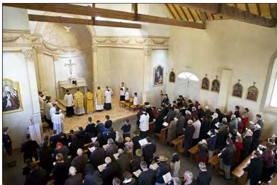
Inauguration de la chapelle Saint-Anthelme, décembre 2014

qu'où ira-t-on ? Nous savons que Notre-Seigneur n'abandonnera pas son Eglise qui ne peut sombrer. Nous gardons confiance contre vents et marées mais il nous faut supplier Dieu qu'il mette un terme à cette passion qui s'éternise et cause la perte d'un grand nombre d'âmes.