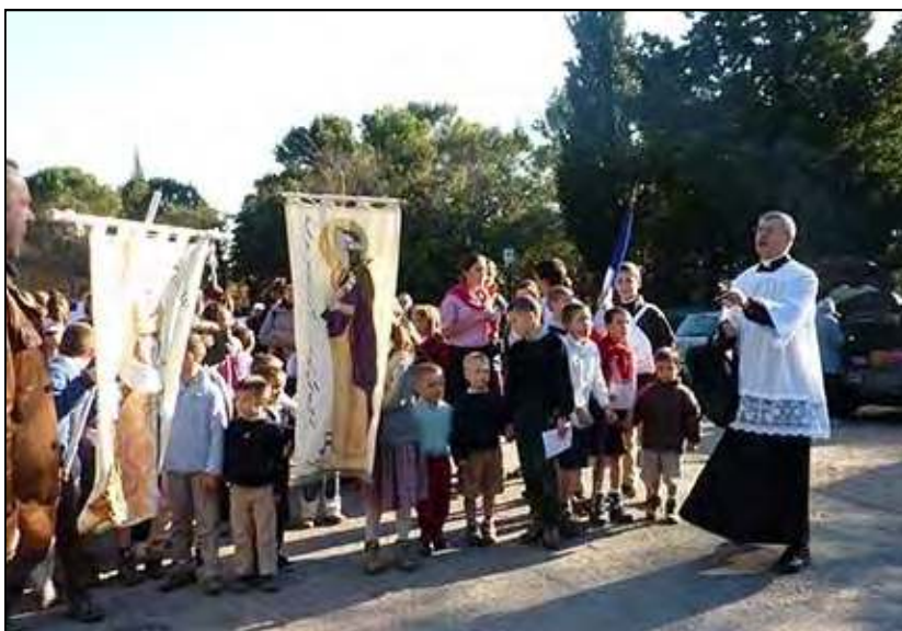
Pèlerinage à Cotignac (83), 2015

Cependant la loi de Dieu, expression de son éternelle charité pour les hommes, constitue par elle-même la souveraine miséricorde pour tous les temps, toutes les personnes et toutes les situations. Nous prions donc pour que la vérité évangélique du mariage, que devrait proclamer le Synode, ne soit pas contournée en pratique par de multiples « exceptions pastorales » qui en dénatureraient le sens véritable, ou par une nouvelle législation qui en abolirait quasi infailliblement la portée réelle. Sur ce point, nous ne pouvons vous dissimuler que les récentes dispositions canoniques du Motu proprio Mitis iudex Dominus Iesus , facilitant des déclarations de nullité accélérées, ouvriront la porte de facto à une procédure de « divorce catholique » qui ne dit pas son nom, en dépit des rappels sur l'indissolubilité du mariage