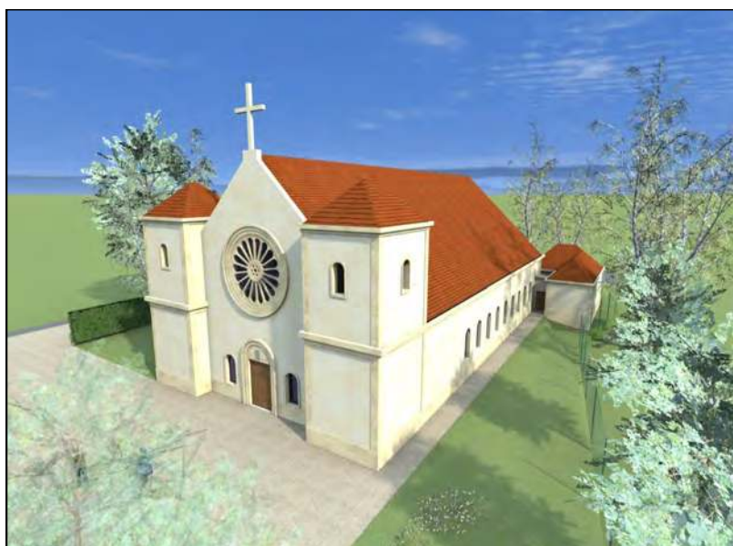
Projet de la future chapelle de Bailly (78)

« Tu ne convoiteras pas la femme de ton prochain » (Ex 20, 17). L'Évangile nous enseigne que Jésus lui-même, en vertu de son autorité