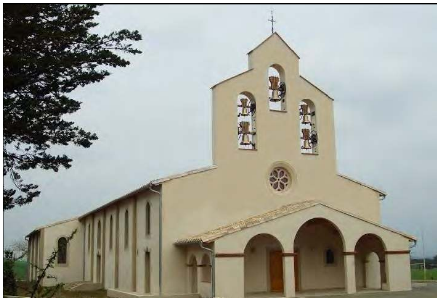
Chapelle de l'école Saint-Joseph-des-Carmes (11)

Les ténèbres du laïcisme semblent se répandre inexorablement sans rencontrer aucune résistance. Seule la solution catholique portée par l'Eglise peut soigner la société agonisante. Il est consternant de