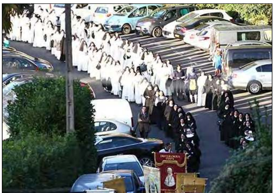
Pèlerinage du Christ-Roi, Lourdes, 2014

Quelle clairvoyance ! Le laïcisme dénoncé hier par Pie XI ne cesse aujourd'hui de s'étendre comme un cancer, cherchant à effacer toute trace de chrétienté dans la société. Le laïcisme sorti des officines de la franc-maçonnerie a sa doctrine, ses dogmes, ses rites, ses thuriféraires, ses fêtes, ses saints, sa morale. C'est une nouvelle religion que nos politiques cherchent à nous imposer.