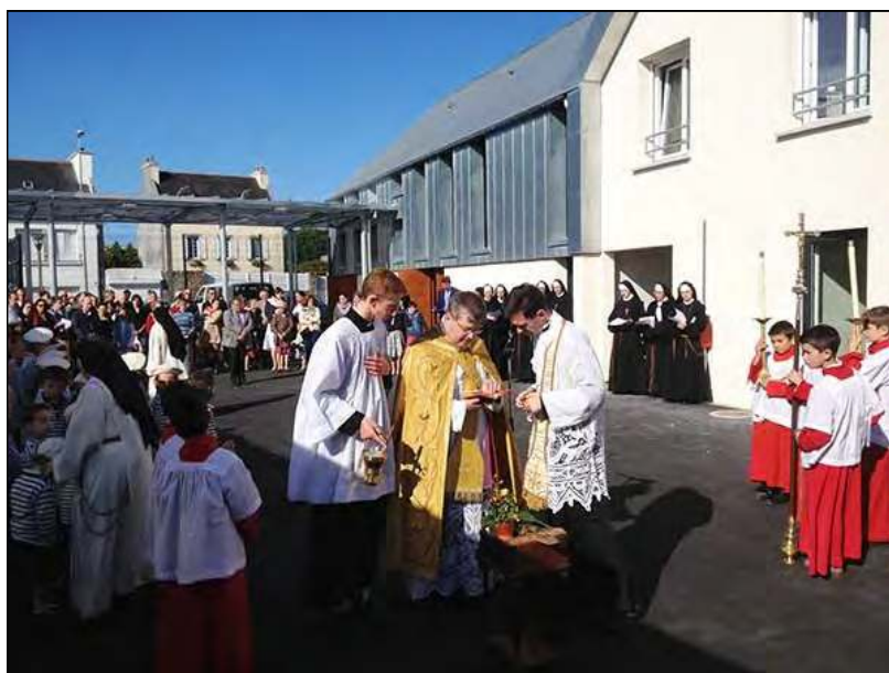
Bénédition de la chapelle de l'école Stella Maris à Brest (29), septembre 2015

Cependant, attention de ne pas donner prise au prince de la division, au Malin, qui rôde cherchant à diviser nos rangs en y semant le trouble, le doute et le découragement. Restons unis autour de nos prêtres et de nos Supérieurs dans le combat de la foi que la Fraternité veut mener dans la fidélité