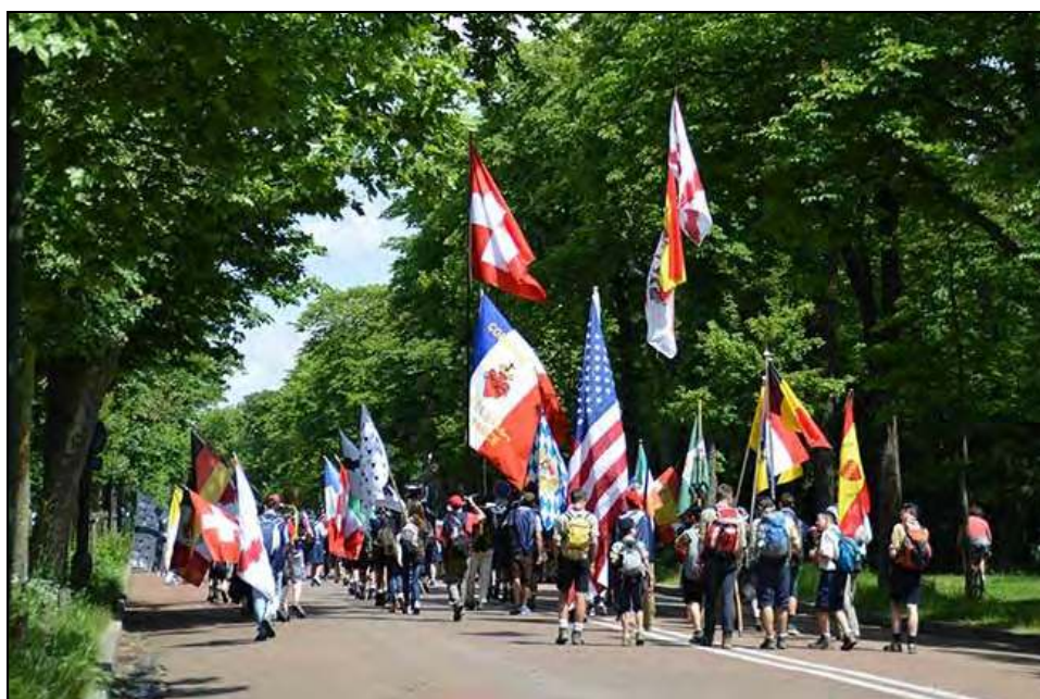
Pèlerinage de Pentecôte 2015

D'importants travaux de restauration de la collégiale de Thouars (79) doivent être entrepris d'urgence.