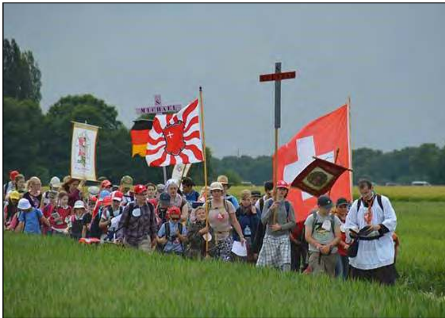
Pèlerinage de Pentecôte, de Chartres à Paris, 2015

longtemps une semblable séparation des individus et des peuples d'avec le Christ (...) nous les déplorons aujourd'hui de nouveau : les