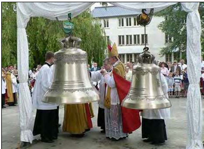
Bénédition des cloches de la Martinerie (36), juin 2015

lieux où brillent la sainteté, la charité et la vérité. Que le Christ-Roi y règne ! Plus que jamais, nous devons travailler chacun à notre place à