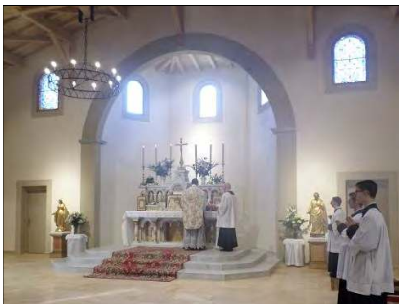
Inauguration de la chapelle Saint-Joseph-des-Carmes, mars 2015

C'est un fait ; nos églises sont vides, nos séminaires désertés et la pratique religieuse a chuté de façon vertigineuse. Pourquoi ce désastre ? Quelle est la