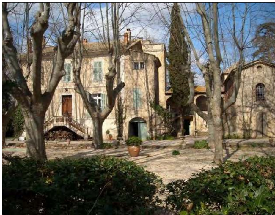
Futur prieuré en Avignon (84)

Dieu auteur de la nature a établi l'union stable de l'homme et de la femme en vue de perpétuer l'espèce humaine. La Révélation de l'Ancien Testament nous apprend, de la façon la plus évidente, que le mariage, unique et indissoluble, entre un homme et une femme, a été établi directement par Dieu, et que ses caractéristiques essentielles ont été soustraites par lui au libre choix des hommes, pour demeurer sous une protection divine toute particulière :