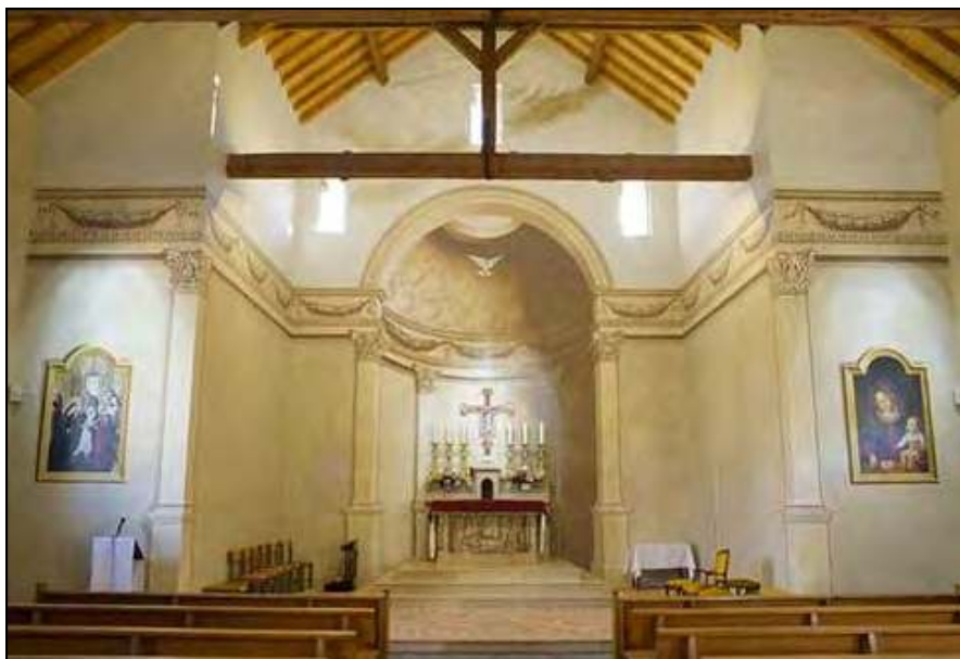
Chapelle Saint-Anthelme, Saint-Baldoph (73)

cause de cette situation dramatique ? Est-ce le matérialisme ambiant ? Certes, il est un facteur qu'il ne faut pas négliger. Mais est-il le principal ? Il faut répondre par la négative. Le responsable de cette ruine est principalement le dernier concile qui a voulu marier l'Eglise avec l'esprit du monde. Cet aggiornamento initié par Jean XXIII et porté par tous ses successeurs a