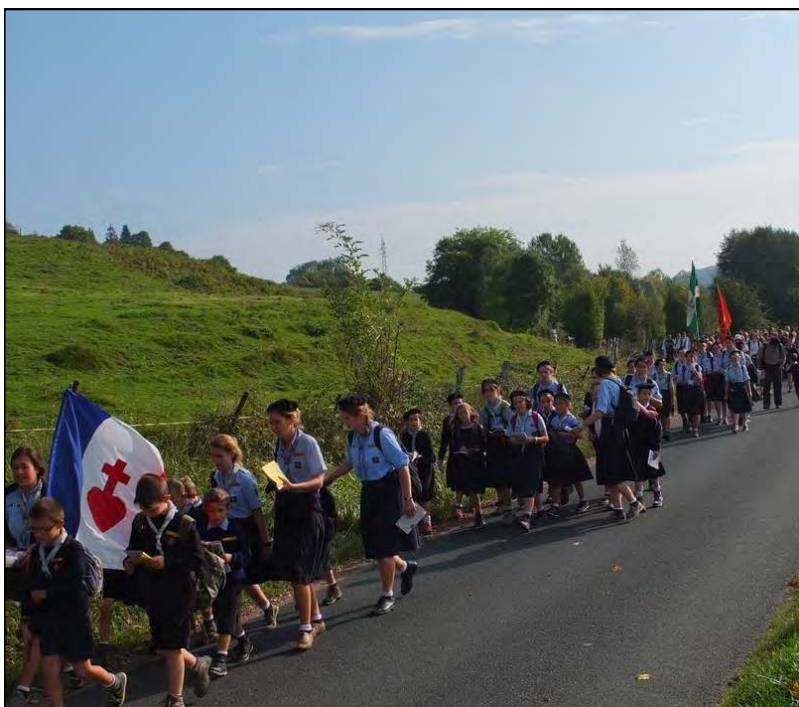
Pèlerinage à Lisieux (14), 2014

dans l'encyclique Pascendi , un tel alignement du dogme sur de prétendues exigences contemporaines. Pie X et vous, Très Saint Père,