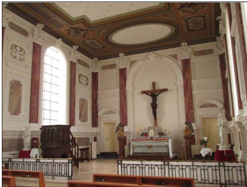
Chapelle Saint-Vincent-de-Paul, Amiens (80)

L'homme-dieu doit remplacer le Dieu fait homme. Il est en effet impressionnant et effrayant de constater vers quel abyme ce laïcisme