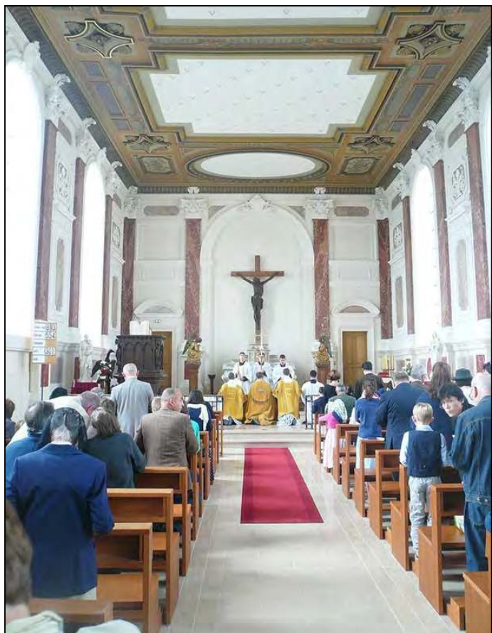
Inauguration de la chapelle Saint-Vincent-de-Paul, juin 2015

Pour dénoncer de telles horreurs, étaient auparavant convoqués sur les plateaux de télévision des hommes d'Eglise, mais ils sont devenus tellement timorés que leurs avis n'intéressent plus ! Alors quelques intellectuels les ont remplacés tel un Eric Zemmour ou un Alain Finkielkraut qui parlent avec un certain courage mais sans donner la seule réponse qui vaille : la solution catholique ! Il faut relire le communiqué alambiqué de la conférence épiscopale française sur la situation dramatique de Vincent Lambert. Un chef-d'œuvre de langue de buis ! Cependant, quelques évêques isolés ont été courageux et ont sauvé l'honneur.