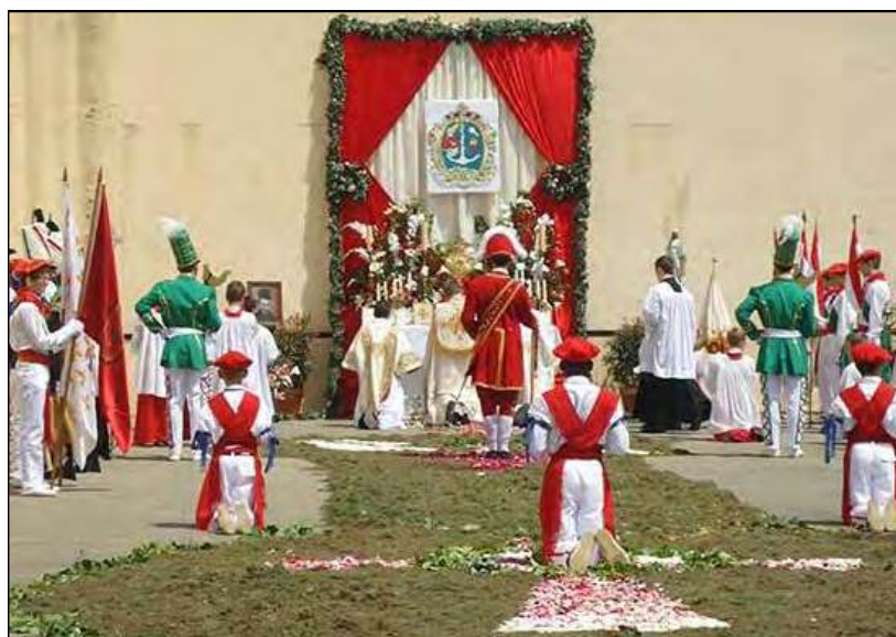
Fête-Dieu à Domezain (64), juin 2015

Pour l'honneur de Notre-Seigneur Jésus-Christ, pour la consolation de l'Église et de tous les fidèles catholiques, pour le bien de la société et de l'humanité tout entière, en cette heure cruciale, nous vous sup-