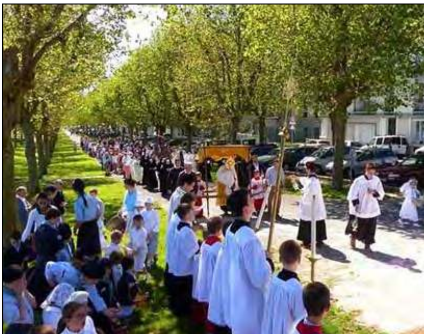
Procession de la Fête-Dieu à Brest (29), juin 2015

qui l'accompagnent. Ces dispositions suivent l'évolution des mœurs contemporaines, sans chercher à les rectifier selon la loi divine ; com-