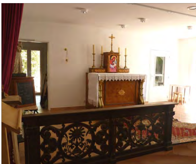
Chapelle Notre-Dame-de-l'Assomption, Afa (Corse)

Vous trouverez dans tous vos prieurés ou sur le site de La Porte Latine , les feuillets pour comptabiliser les chapelets récités et les pénitences accomplies. Monseigneur Fellay nous fixe comme objectif