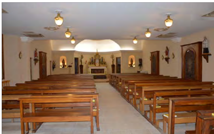
Chapelle Saint-Irénée, Lyon (69)

3) « De Dieu, on ne se moque pas » (Gal 6,7). Voici, selon le témoignage de sœur Lucie, les paroles de Notre-Seigneur lui-même, deux ans après que Notre-Dame soit venue lui dire, en 1929, que le temps de la consécration de