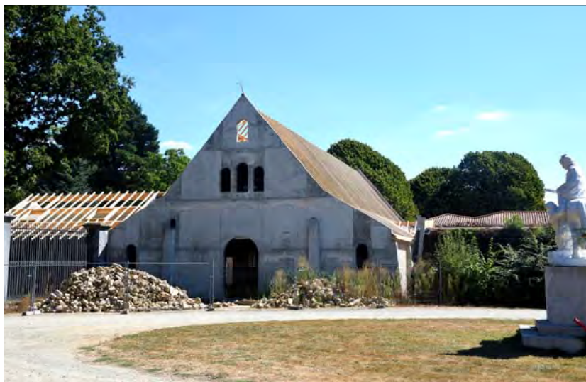
Future chapelle de la Placelière (44)

C'est pourquoi, plus que jamais il faut prier pour les vocations sacerdotales et religieuses. La tâche peut paraître surhumaine.