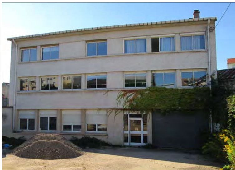
Futur prieuré de Nancy (56)

Le prêtre, en effet, perpétue le sacrifice du Calvaire chaque fois qu'il célèbre la messe et distribue les mérites qui en découlent dans son apostolat quoti-