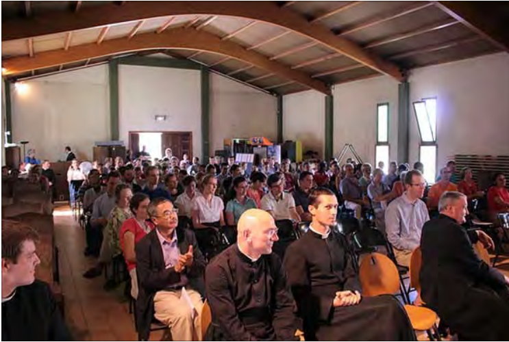
XI e université d'été, Montréal-de-l'Aude (11)

lique, et, par-dessus tout, les gémissements de tant de petits enfants qui, devant les tabernacles répandent leur âme dans les expressions que Dieu même met sur leurs lèvres, appelleront certainement sur cette nation les