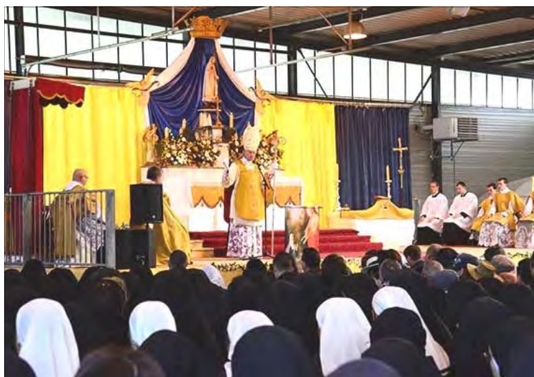
Pèlerinage à Notre-Dame du Puy-en-Velay, 2016

multiséculaire peuvent s'opposer efficacement au déferlement auquel nous