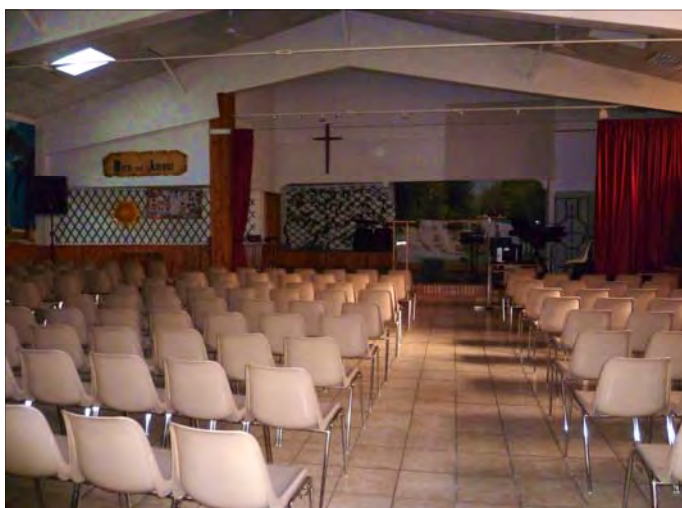
Future chapelle de Montauban (82)

2) La deuxième vérité fondamentale qui ressort du message de Fatima est bien l'intervention réelle du Dieu Tout-Puissant dans l'histoire des hommes, soit comme individus, soit comme nations. Il s'agit là d'une vérité évidente pour nous, mais qui est aujourd'hui très attaquée dans un monde athée, libéral ou socialo-communiste, un monde maçonnique qui prétend réaliser ses ac-