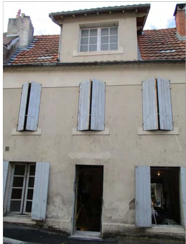
Réhabilitation d'une dépendance du prieuré de Bergerac (24)

Le district de France de la Fraternité Saint-Pie X veut de toute son âme travailler, à sa modeste place, à la reconstruction de l'Église en la servant dans la fidélité. Il désire aussi œuvrer pour que la France catholique renaisse en sanctifiant les âmes qui lui sont confiées, en formant une jeunesse réellement catholique désireuse de se mettre au service de l'Église et de la France,