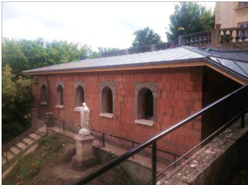
Future chapelle du district de France de Suresnes (92)

tivités, mener à terme ses projets, sans aucun regard sur le Créateur et Sauveur, Dieu, Notre Seigneur Jésus-Christ. Malheureusement, beaucoup d'hommes d'Église sont, eux aussi, imbus de cette idée selon laquelle