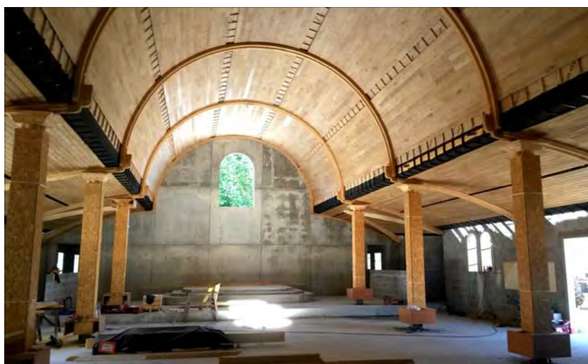
Future chapelle de la Placelière (44)