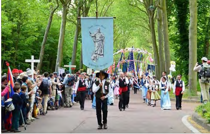
Pèlerinage de Pentecôte, 2016

triomphe du Cœur Immaculé de Marie, à l'occasion de la consécration de la Russie par le Saint-Père, auquel seront unis les évêques du monde entier. Avec ce triomphe, un temps de paix est promis au monde et à l'Église.