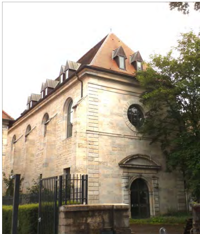
Future chapelle de Besançon (25)

écoles et les communautés amies qui le souhaiteront. Je compte sur vous pour lui faire un accueil triomphal et fervent ! Je vous en parlerai bientôt !