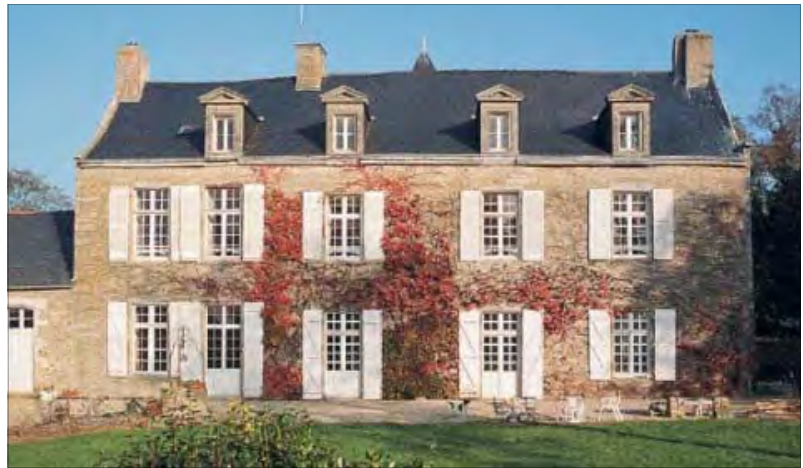
Futur prieuré de Vannes (56)

filiale du triomphe de son Cœur Immaculé et de la consécration de la Russie, selon les indications de Notre-Dame elle-même. Et enfin, dans les temps troublés que nous connaissons, tant dans le monde que dans l'Église, nous demandons à notre Mère céleste une protection particulière pour la Fraternité Saint-Pie X, toutes ses œuvres et toutes les sociétés religieuses amies.