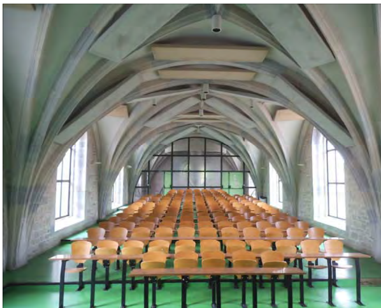
Future chapelle de Besançon (25), à restaurer

Le pape saint Pie X avait annoncé les épreuves que nous traversons. Il en avait donné les raisons mais aussi les moyens pour que la France catholique renaisse. Voici la fameuse prophétie qu'il prononça à l'occasion de l'imposition de la barrette à des cardinaux français le 29 novembre 1911 : « Que vous dirai-je maintenant à vous, chers fils de France qui géissez sous le poids de la persécution ? Le peuple qui a fait alliance avec Dieu aux fonts baptismaux de Reims se repentira et retournera à sa première vocation. Les mérites de tant de ses fils qui prêchent la vérité de l'Évangile dans le monde presque entier et dont beaucoup l'ont scellée de leur sang, les prières de tant de saints qui désirent ardemment avoir pour compagnons dans la gloire céleste les frères bien-aimés de leur