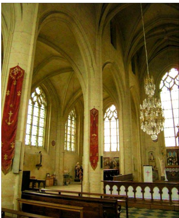
Collégiale de Thouars (79), à restaurer

Nous vous invitons tous, pour l'amour de la Mère de Dieu, de son Cœur douloureux et immaculé, à multiplier les actes qui nous feront, nous-mêmes, pratiquer plus intensément cette dévotion et la diffuser. Ainsi, nous vous proposons de consacrer, après une diligente préparation, vos foyers et vos œuvres au Cœur Immaculé, de bien pratiquer la dévotion des cinq premiers samedis du mois, de porter personnellement le scapulaire de Notre-Dame du Mont-Carmel, et de diffuser la Médaille Miraculeuse donnée par la sainte Vierge à la rue du Bac, à Paris, médaille qui montre sur son revers les deux Cœurs de Jésus et de Marie.