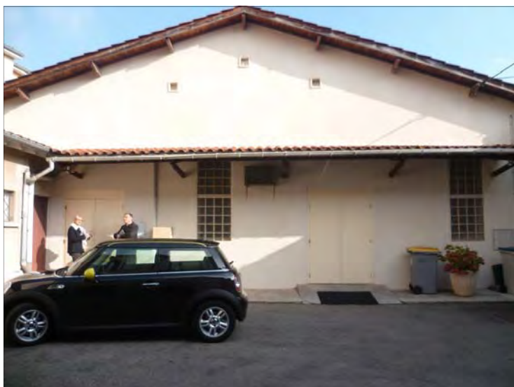
Future chapelle de Montauban (82)

1) L'essentiel du message réside dans ces paroles de la Sainte Vierge à sœur Lucie, le 13 juin 1917 : « Jésus veut se servir de toi afin de me faire connaître et aimer. Il veut établir dans le monde la dévotion à mon Cœur Immaculé. A qui embrassera cette dévotion, je promets le salut. Ces âmes seront chéries de Dieu, comme des fleurs placées par Moi pour orner son Trône. »