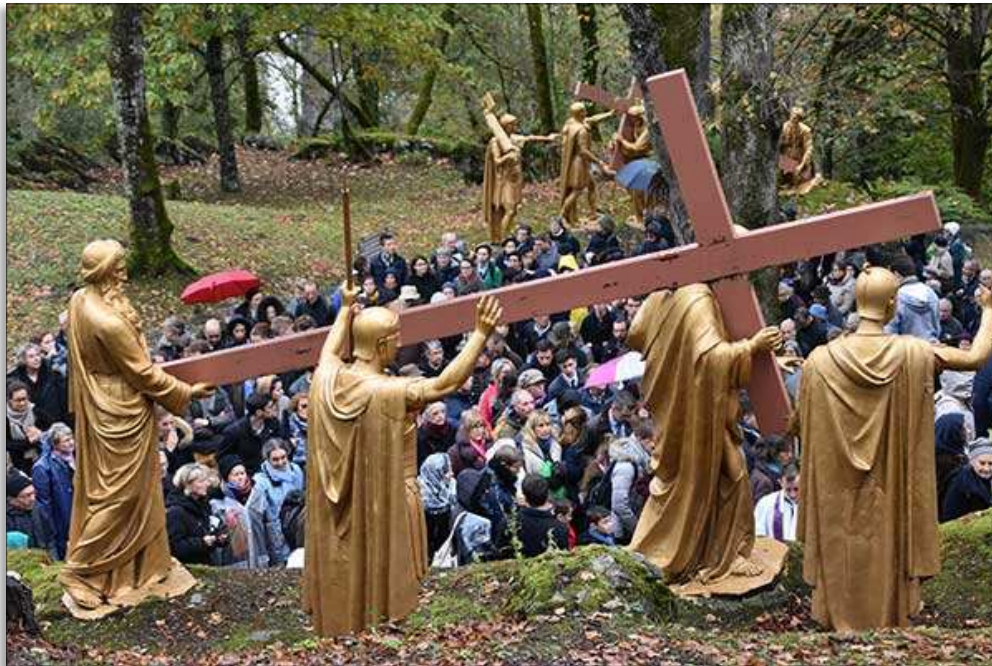
Pèlerinage de Lourdes, octobre 2018, 160 ème anniversaire des apparitions

Comme vous pouvez le constater, et comme il est naturel pour tenir compte de l'écoulement du temps, le Chapitre général a entraîné des changements dans les hommes, le renouvellement des instances de direction. Mais il n'a aucunement entraîné un changement dans la Fraternité Saint-Pie X elle-même, dans sa nature, sa mission, son fonctionnement, ses positions doctrinales, liturgiques, morales et pratiques.