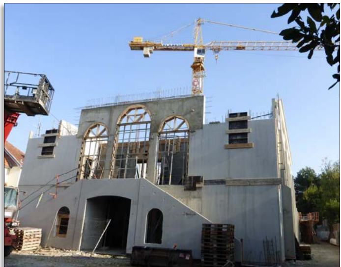
Future église de Nantes (44)