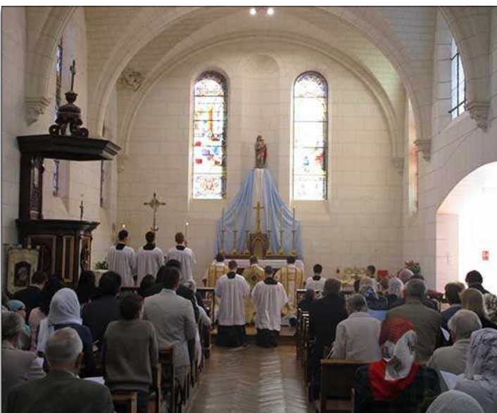
Bénédictio de la nouvelle chapelle de l'Immaculée, mai 2018, St-Jean-de-la-Ruelle (45)

La seconde raison est que le concile Vatican II, ainsi que les réformes qui en sont issues, ont contribué et contribuent encore aujourd'hui à la ruine de l'Église, ruine dont nous sommes les témoins attristés et effrayés. Donnons un simple exemple, très parlant. La Fraternité Saint-Pie X a été