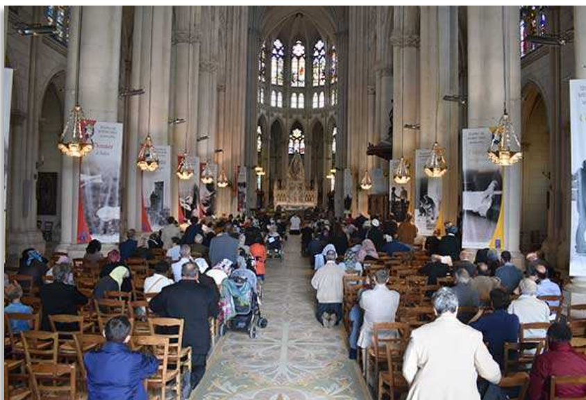
30 ème pèlerinage à Notre-Dame de Montligeon pour la délivrance des âmes du purgatoire, Broût-Vernet (03)

C'est paradoxal, mais il n'y a que la Fraternité qui pourra aider l'Église, en rappelant aux papes et aux évêques que Notre-Seigneur a fondé une Église monarchique et non pas une assemblée moderne chaotique. Le jour arrivera où ce message sera écouté. Pour l'instant, c'est notre devoir de garder ce sens profond de l'Église et de sa hiérarchie, malgré le champ de bataille et les ruines que nous avons sous les yeux.