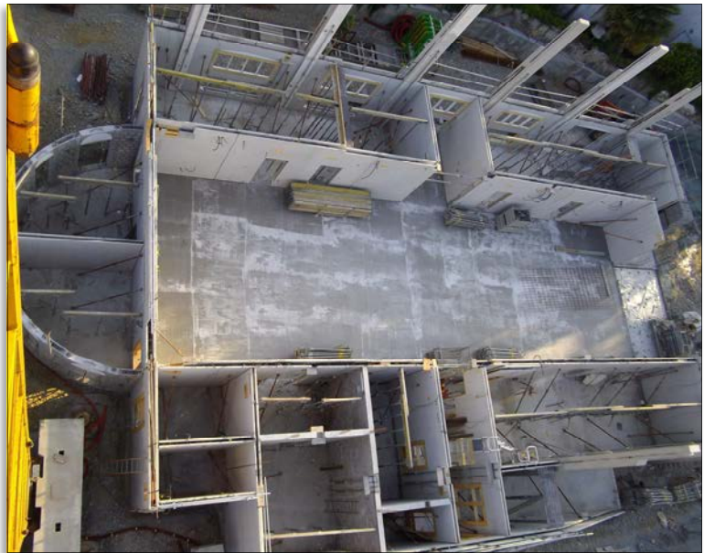
Future église de Nantes (44)

Chers bienfaiteurs, cette œuvre de la Fraternité Saint-Pie X, qui est aujourd'hui la même qu'hier, à savoir garder et proclamer la foi catholique, et transmettre les sacrements de la foi dans leur intégrité, cette œuvre de la Fraternité Saint-Pie X est toujours, et je dirais de plus en plus, manifeste et nécessaire.