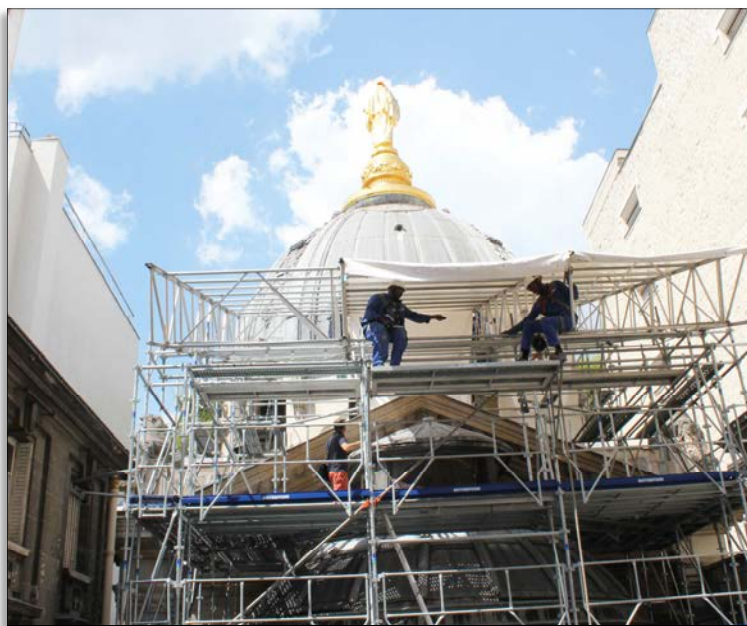
Restauration des coupoles, chapelle Notre-Dame-de-Consolation, Paris (75)