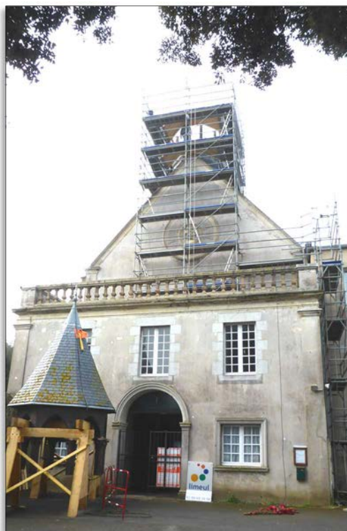
Restauration du clocher, chapelle Sainte-Anne, Saint-Malo (35)

nous disent, elles nous rappellent, elles nous soulignent, et encore récemment, que cette structure juridique ne pourra être envisagée que dans la