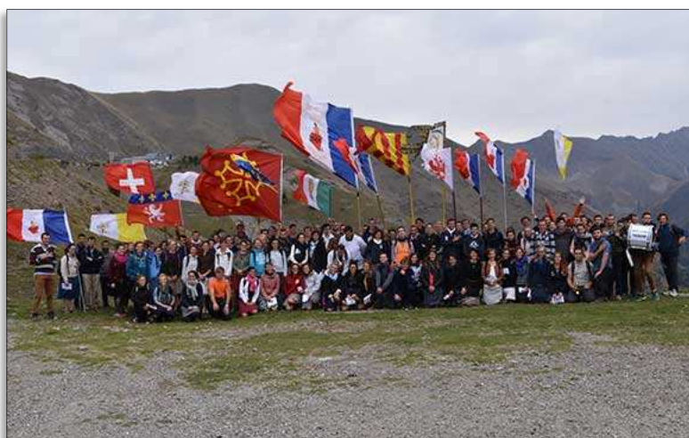
Pèlerinage des jeunes à Notre-Dame de la Salette, octobre 2018, Lyon (69)

Mais il faut lire cette canonisation aussi à la lumière de l'état présent de l'Église, car l'empressement à canoniser les papes du Concile est un phénomène relativement récent et il a connu son expression la plus manifeste avec la canonisation presque immédiate de Jean-Paul II. Cette détermination à