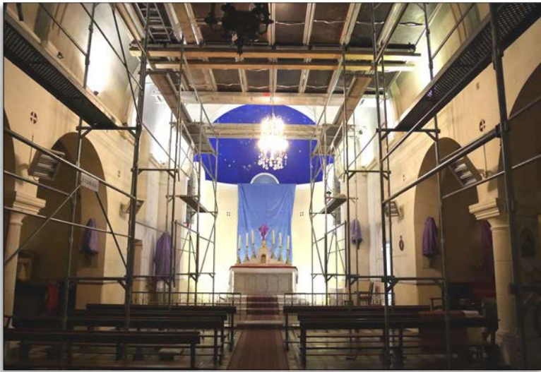
Restauration de la chapelle Notre-Dame-de-Toutes-Grâces, Périgueux (24)

Oh !, nous dit-on, rassurez-vous, il s'agirait du concile « interprété dans le sens de la Tradition », du concile « authentique » et non point du « concile des médias », du concile à propos duquel il serait loisible de faire