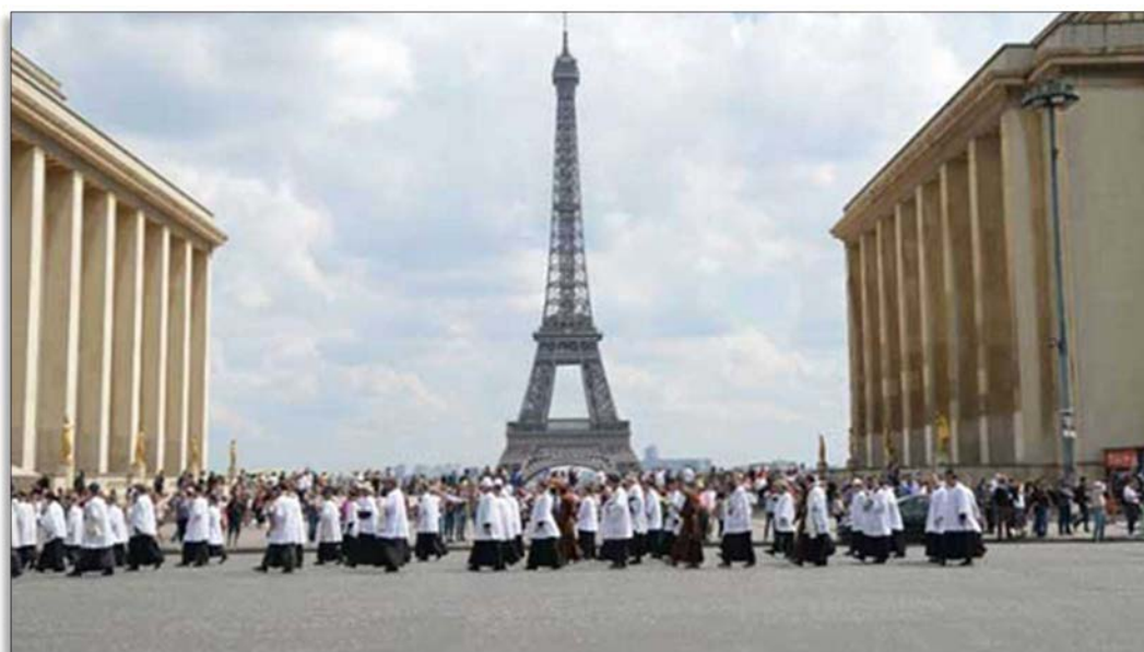
Pèlerinage de Pentecôte, Chartres-Paris, mai 2018

(1) Voir le communiqué de la Maison Générale du 13 octobre 2018 : Au sujet de la scandaleuse canonisation de Paul VI.