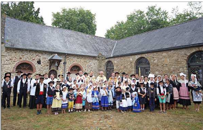
Le grand pardon de sainte Anne, 29 juillet 2018, Lanvallay (22)

Je suis persuadé que la vraie solution pour augmenter le nombre de vocations et leur persévérance ne réside pas en premier lieu dans des moyens humains et pour ainsi dire « techniques », tels que bulletins, tournées apostoliques ou publicité. Tout d'abord, une vocation a besoin pour éclore d'un foyer où l'on aime Notre-Seigneur, sa Croix et son sacerdoce ; un foyer où l'on ne respire pas l'amertume ni la critique envers les prêtres. C'est par osmose, au contact de parents véritablement chrétiens et de