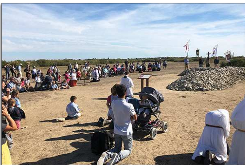
Pèlerinage aux prêtres martyrs de l'Île Madame septembre 2018, Bruges (33)

De fait, on en parle très souvent, même dans des débats qui ont un autre objectif ou d'autres thèmes à traiter. Je pense, par exemple, au dernier synode sur la jeunesse où le sujet a été évoqué pour la énième fois. Cela