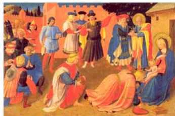
(Fra Angelico) N° 6