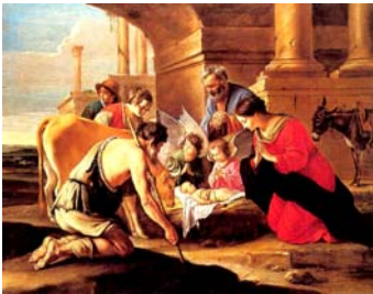
(le Nain) N° 1