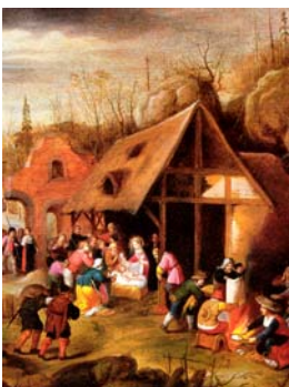
(Ecole Flamande) N° 5