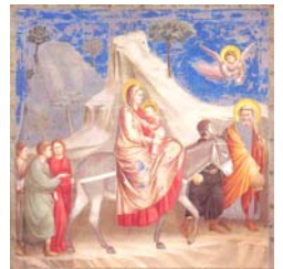
(Giotto) N° 4