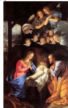
(de Champagne) N° 3