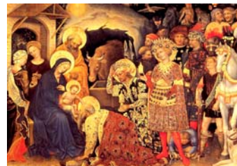
(Fabriano—Florence) N° 7