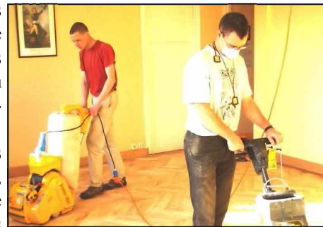
Ponçage/vitrification des parquets