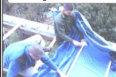
Bâchage du toit