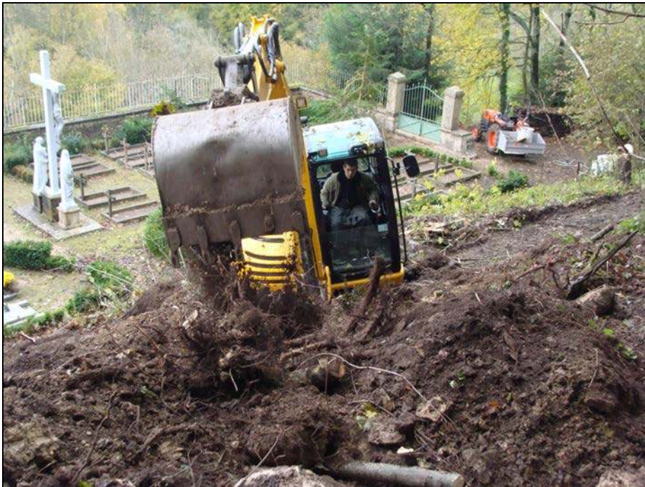
Nouvel accès au cimetière