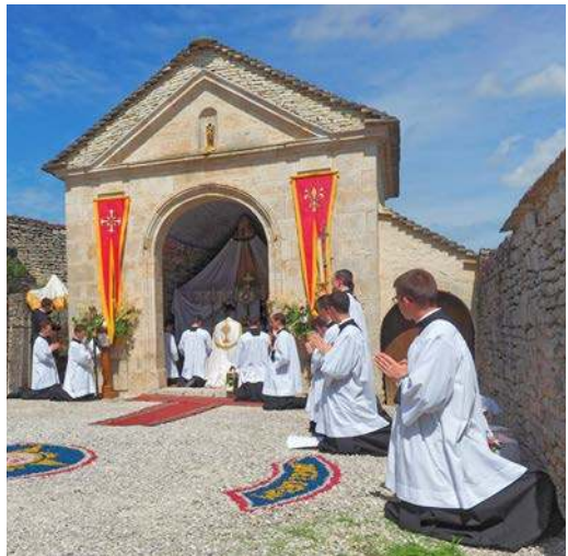
Reposoir de la Fête-Dieu à l'ancien oratoire des Ursulines

En effet, les parents sont les premiers éducateurs de leurs enfants. Ils ont donc pour mission de transmettre à leur progéniture les vertus chrétiennes. Aussi n'est-il pas étonnant de constater que la plupart des séminaristes ont leur mère au foyer ; ils ont été formés dans des écoles traditionnelles et sont issus, en moyenne, de famille de six enfants. Une éducation dispensée par de bons parents et éducateurs produit des fruits merveilleux. Beaucoup de séminaristes et de frères sont très équilibrés. Ils sont pieux, studieux,