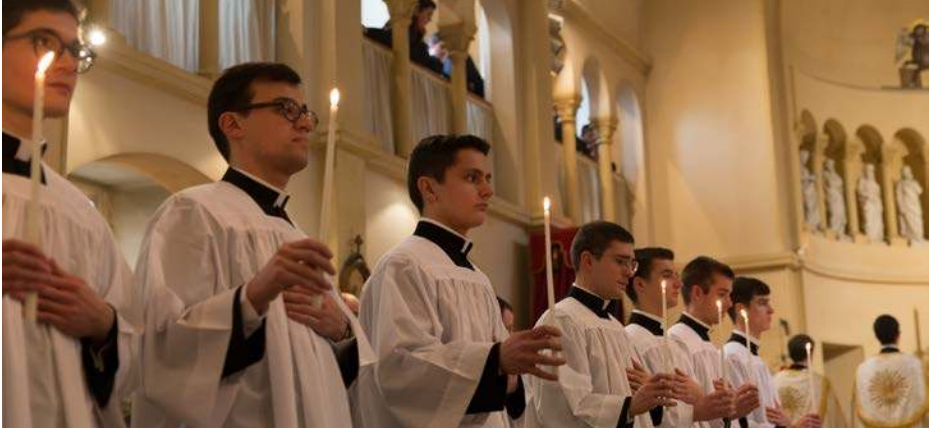
Le 2 février 2018, 16 séminaristes ont reçu la soutane.

Pourtant je vous assure qu'il faut commander ferme et sans faiblesse si on veut en faire des hommes, c'est la source du respect. [..] Votre faiblesse à leur égard est cause qu'ils ne vous respectent pas assez 2 . »