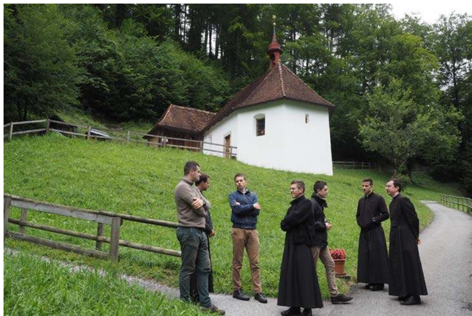
L'ermitage et la chapelle où saint Nicolas de Flüe passa les vingt dernières années de sa vie.