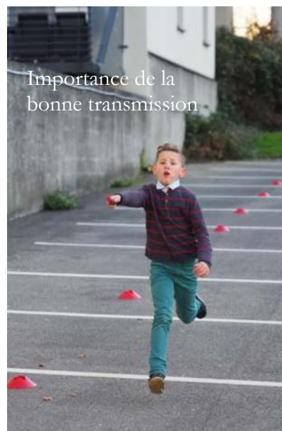
Importance de la bonne transmission