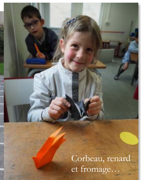
Corbeau, renard et fromage...