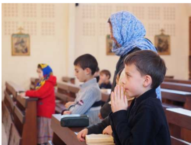
Messe d'école et confessions chaque semaine

A la pratique des sacrements, vient s'ajouter tout un cortège de dispositions qui sont là pour favoriser la vie intérieure des enfants.