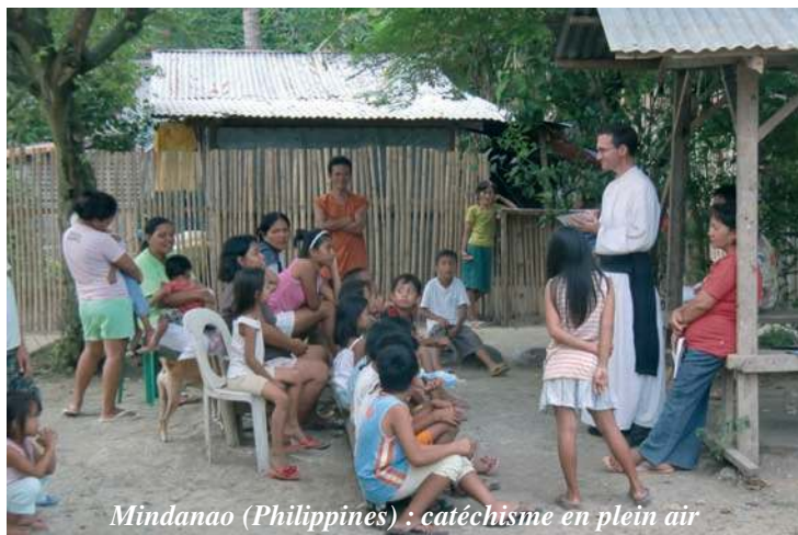
Mindanao (Philippines) : catéchisme en plein air

- Rappelons-nous comment le dossier a été ouvert : lors du pèlerinage à Rome, les prêches de nos évêques ont bouleversé les idées reçues des prélats romains et leur ont fait se poser des questions sur la sanctification du prêtre. Cette sanctification du prêtre, tant prêchée par Mgr Lefebvre, qui fait accourir les séminaristes à Écône. Et pour cela, la Providence emprunte parfois les chemins d'Internet pour ceux qui n'ont pas eu la chance d'être élevés dans la Tradition 2 .