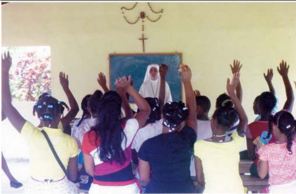
La Gina, Jamasá, le 19 mai 2015

Nous avons la chance d'avoir une chapelle à 20, 30, 100 km et de recevoir les sacrements de façon régulière, pensons à ces âmes privées de l'essentiel.