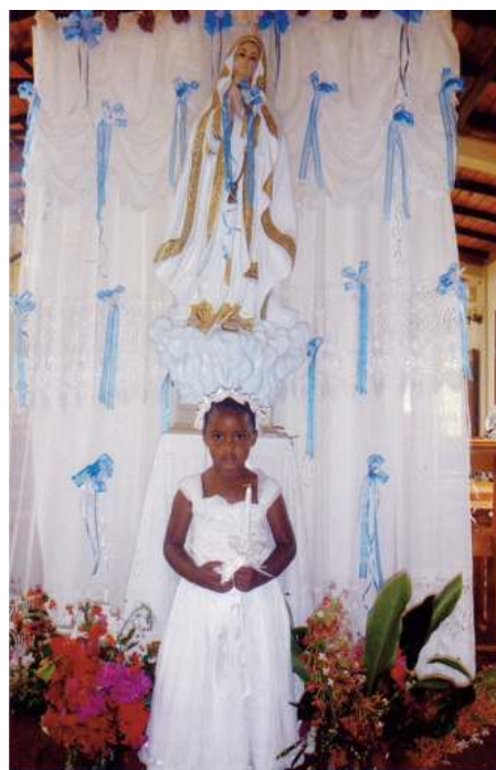
Communion solennelle en République Dominicaine sous la protection de la Sainte Vierge

Et voici que le cardinal Kasper propose d'envisager que des éléments du sacrement de mariage se trouvent dans un mariage simplement civil ! Et puis, n'ont-ils pas pris l'habitude de faire ce qui leur plaisait, depuis la communion dans la main malgré l'interdiction formelle des cardinaux de la curie ?