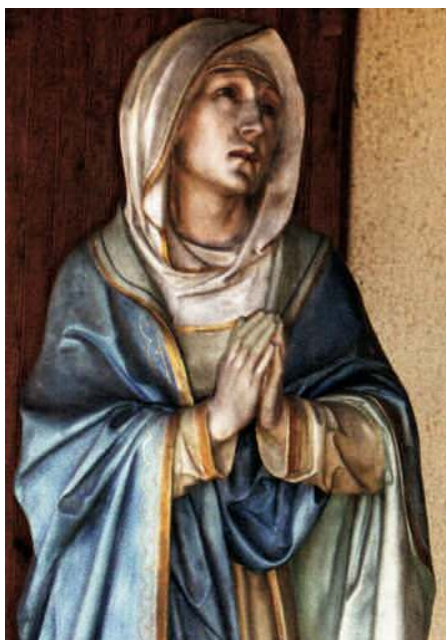
Notre-Dame de Compassion

C'est ainsi que celle qui fut la Fille aînée de l'Église au temps où elle secourait les Chrétiens, se joint aux puissances financières.