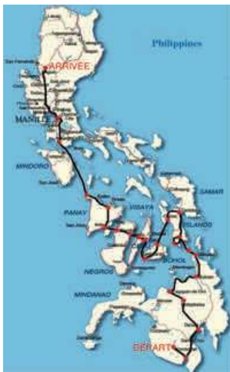
Itinéraire de la Vierge pèlerine aux Philippines

«Prévoyant la terrible crise dans laquelle l'Église tournerait le dos à la loi de Dieu, au dogme, à la discipline et la Tradition catholique, Dieu a envoyé la Vierge Marie à Fatima en 1917. Par cet événement prophétique symbolisé dans le chapitre 12 de l'Apocalypse, Marie elle-même se montre comme la femme revêtue du soleil qui livre bataille à Lucifer. La date choisie de 1917 indique clairement son intention de lutter contre le protestantisme fondé en 1517, la franc-maçonnerie fondée en 1717, et le communisme bolchevique fondé en 1917. À l'aube de 2017, le centenaire de Fatima nous offre une pause et ranime nos espoirs et nos désirs de travailler efficacement au triomphe absolument certain du cœur Immaculé de Marie.