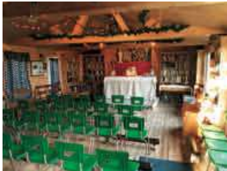
Chapelle de Notre-Dame des Bois

À Sherbrooke, là aussi on reconstruit l'Église et une petite église dans un ancien garage qui sent encore la vieille huile de vidange... Je pense qu'à Bethléem c'était mieux...? Il y a trois années,