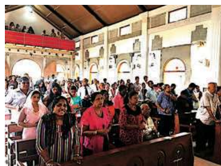
Messe à N-D de Guadalupe

Lorsqu'il était connu autrefois sous le nom de Ceylan, il évoquait tout autre chose. Ceylan est encore aujourd'hui