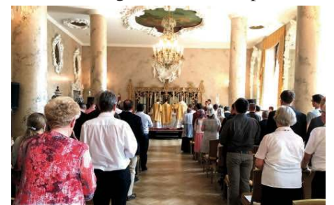
Messe dans la salle de bal de l'hôtel Léningradskaïa

C'est dans la vaste salle de bal de l'hôtel Léningradskaïa, sur la place des