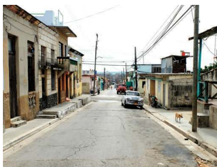
la précarité des habitants, leur extrême pauvreté...

Nous y découvrons la précarité des habitants, leur extrême pauvreté, ce qui explique pourquoi une bonne partie des Cubains a fui la dictature en abandonnant tout ce qu'ils possédaient. On peut dire que l'essentiel de l'élite du pays est parti. Aujourd'hui les habitants doivent vivre avec 15 dollars par mois ! Avec les fameuses cartes de rationnement vous pouvez obtenir quelques petites choses à des prix défiant toute concurrence, ce qui permettra de vivre 2 semaines ; pour le reste vous devrez acheter dans les magasins ce que vous pourrez au tarif touriste ou bien vous lancer dans le marché noir.