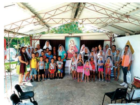
L'accueil des fidèles, ...brille par sa joie surnaturelle

Toutefois, les cubains ont maintenu, malgré la persécution, un certain esprit religieux. 70% de la population sont baptisés bien que la pratique soit très basse. Sectes et charlatans pullulent sans parler de la sorcellerie qui est omniprésente.