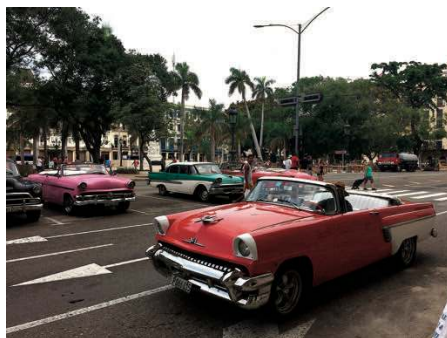
...tout droit sortie des films des années cinquante

Les visites régulières (une fois tous les trois mois, soit quatre fois par an !) ont commencé en 2012. Les prêtres viennent normalement du Mexique, ce pays étant le plus pratique pour accéder à Cuba. Aujourd'hui nous visitons trois centres de Messe. Un à la Havane (capitale du pays), un à Matanzas (capitale de province à 100 km de la Havane) et un dans un petit village proche de Matanzas.