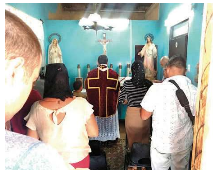
la messe dans une pièce étroite

Cette île, autrefois très fervente, marquée par le passage de Saint Antoine Marie Claret, abritait bon nombre de maisons religieuses. Peut-être que la FSSPX pourra restaurer, pour le moins, l'âme de ce passé glorieux.