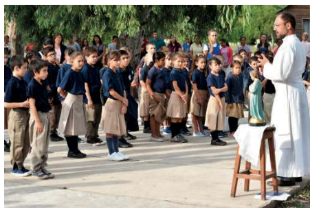
Drapeau de la patrie hissé, après la prière du matin, l'abbé raconte une petite histoire...

Les Mères Dominicaines collaborent aussi avec nous à travers l'institut Santa Catalina qui appartient au collège.