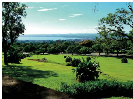
perle des Caraïbes...

Vos découvertes à votre arrivée dans ce pays : cartes de rationnement plus rigoureuses que celles de l'occupation en France, vigilance permanente de la police politique, voitures des années 40-50, autobus avec des assises en métal, édifices et maisons non entretenus voire abandonnés, agriculture délaissée : voilà les premières impressions qui surprennent quand vous arrivez. Bienvenue à Cuba en 2019, jadis perle des Caraïbes ! C'est là le résultat de plus de 50 ans de communisme !