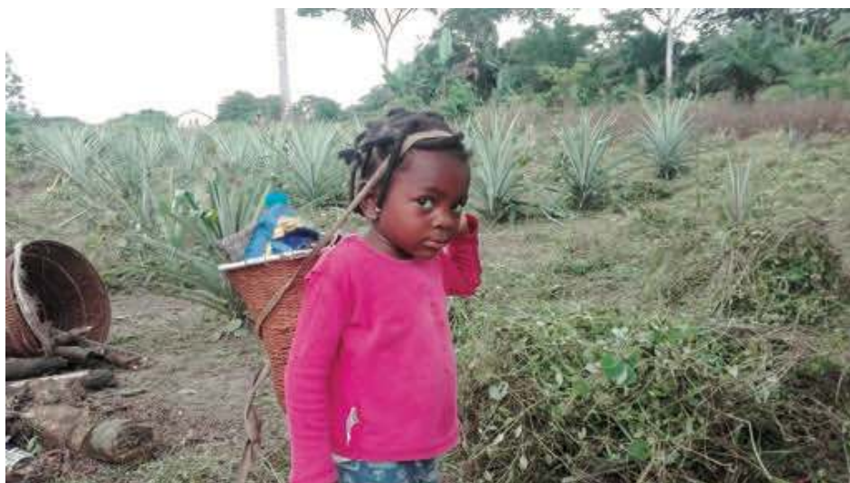
Les travaux des champs occupent tout le monde

tienne. Il a fallu les premières caravelles pour trouver de nouveaux chemins vers le Sud. Mais comme le grand apôtre saint François-Xavier a pu le regretter, s'il y a eu d'éminentes personnalités intéressées à transmettre le bien du christianisme dans toutes les contrées du monde, bien souvent aussi de misérables scélérats n'étaient présents que pour obtenir un misérable profit matériel.