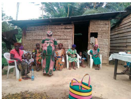
Entre amis un dimanche...

Actuellement arrivent sur le marché gabonais des systèmes d'alimentation solaire. Cela me semble très intéressant pour notre mission St Patrick de Four-Place, à l'intérieur du pays, mission dont j'ai la charge depuis maintenant 6 ans. Là-bas tout est alimenté, éclairage et eau, par un groupe électrogène. Si celui-ci rend de grands services pour la messe du dimanche, les séjours des prêtres, les camps de vacances, il est cependant très onéreux en consommation. Ainsi, sur les cinq dernières années, nous avons estimé que nous avons dépensé pas moins de 12.000 € en carburant et entretien. Ce qui est un budget important pour une petite chapelle où le montant de la quête est de 15 € par dimanche ! Il n'y a qu'une centaine de fidèles, qui vivent tous très simplement de leurs plantations vivrières souvent ravagées par les éléphants, habitant dans de pauvres maisons en bois au sol battu, n'ayant ni électricité ni eau courante. Un vrai retour à la vie de nos villages d'il y a 150 ans.