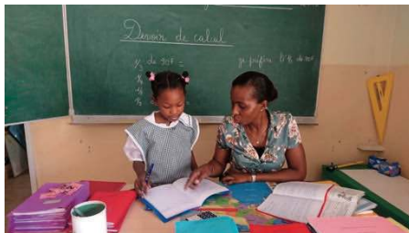
Une élève attentive

Ne souhaitant pas solliciter mon supérieur qui a déjà suffisamment de soucis pour faire tourner la mission de Libreville, je fais appel au bon cœur des âmes charitables pour soutenir ce petit projet. Aussi toute aide, petite ou grande, serait la bienvenue et serait une nouvelle pierre rajoutée à l'édifice.