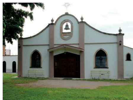
La chapelle de Zapotiltic

Zapotiltic est située à une heure et demie de Guadalajara, l'une des trois villes les plus importantes du Mexique.