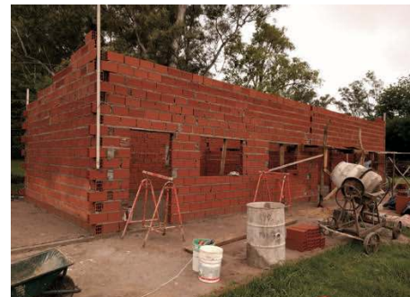
Grâce à nos donateurs, les murs s'élèvent...

Un grand merci à ceux qui, ayant effectué un virement, ne peuvent être remerciés directement, faute de connaître leur adresse.