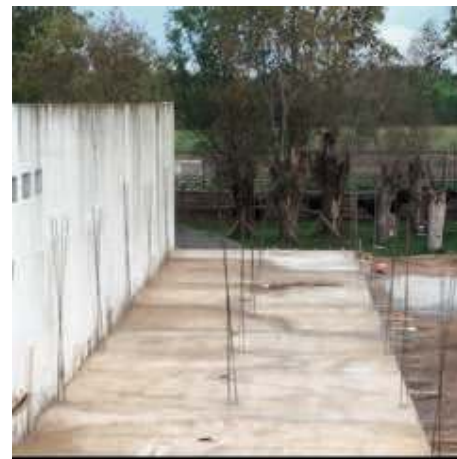
Quand s'élèveront les murs et la dalle de l'étage ?

Ci-dessous, la photo de l'ouvrage commencé depuis un mois. Nous avons pour le moment simplement la dalle de béton.