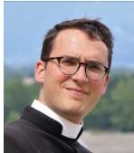
Abbé Jean de Loÿe

A l'heure où la Fraternité Saint-Pie X a discerné dans les sacres un moyen nécessaire pour continuer à servir l'Eglise, prions le Sacré-Cœur de Jésus pour la sanctification des prêtres, l'éclosion et la persévérance des vocations, l'engagement des baptisés mais aussi et particulièrement pour le ministère sacramentel des évêques auxiliaires de la Fraternité.