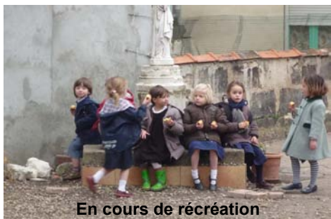
En cours de récréation