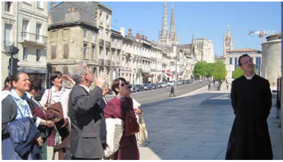
Sortie de l'Atelier Saint-Georges