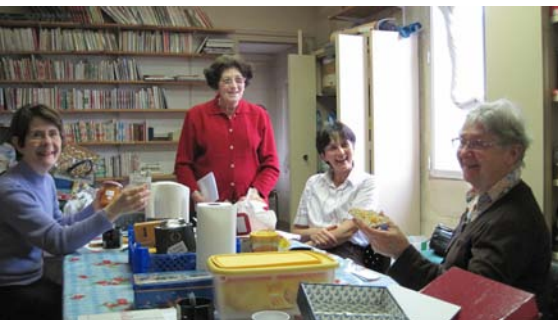
L'Atelier Saint-Georges en pleine action