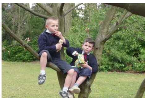
Deux élèves en pique-nique