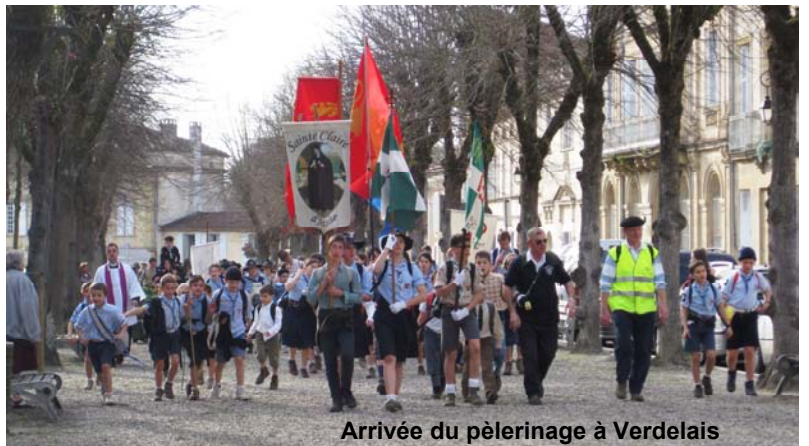
Arrivée du pèlerinage à Verdelaïs

Le Pape Pie XI décide alors, aidé du C al Pacelli et de M gr Faulhaber, archevêque de Munich, de rédiger une encyclique contre l'idéologie hitlérienne. Avec une grande discrétion, l'encyclique, adressée aux évêques allemands, est publiée en langue allemande, cas rare en l'espèce, le 10 mars 1937, pour être lue dans toutes les paroisses allemandes aux Messes des Rameaux (21 mars 1937). La Gestapo (police secrète d'Etat) ne parvint à intercepter que quelques courriers spéciaux contenant l'encyclique Mit brennender sorge (Dans ma poignante inquiétude) . La lecture en chaire de cette encyclique fit clairement de l'Eglise catholique une force d'opposition à l'idéologie hitlérienne.