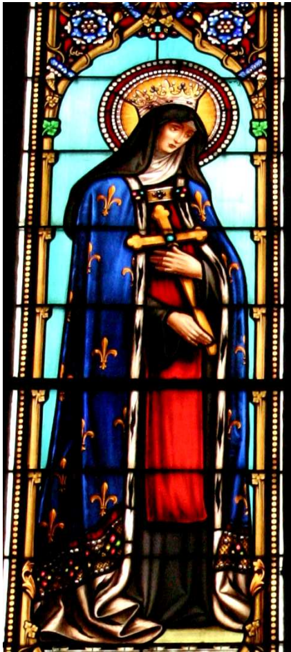
Sainte Jeanne de France Couvent des Annonciades