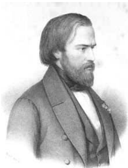
Frédéric Ozanam (1813-1853)

Le but de cette conférence est la sanctification personnelle que nous réalisons à travers l'exercice de la plus sublime des vertus, la vertu de charité, car cet exercice nous permet de devenir de plus fervents chrétiens en exerçant notre charité sur "ces pauvres de Jésus Christ (qui) sont nos seigneurs et nos maîtres" comme se plaisait à dire Saint Vincent de Paul. À travers la conférence nous pouvons soulager leur misère matérielle et