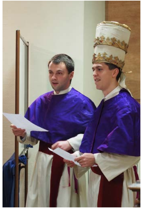
Pièce de théâtre de la journée des bienfaiteurs

Cette interprétation des dispositions intérieures de Notre-Dame n'est pas le fruit d'une simple conjecture ou appréciation subjective, comme certains seraient peut-être portés à le croire. La preuve en est donnée par les paroles du vieillard Siméon. Au moment même où Notre-Dame sort du Temple, pour montrer que son offrande a été agréée par Dieu, Siméon lui prédit que « son Fils sera un signe de contradiction et qu'elle-même, un glaive de douleur lui transpercera l'âme » (Lc 2, 34-35). Siméon annonce ici clairement la Passion de Notre-Seigneur et la compassion de Notre-Dame. En affirmant que Jésus sera un signe de contradiction, il prédit qu'il devra subir la contradiction, qu'il