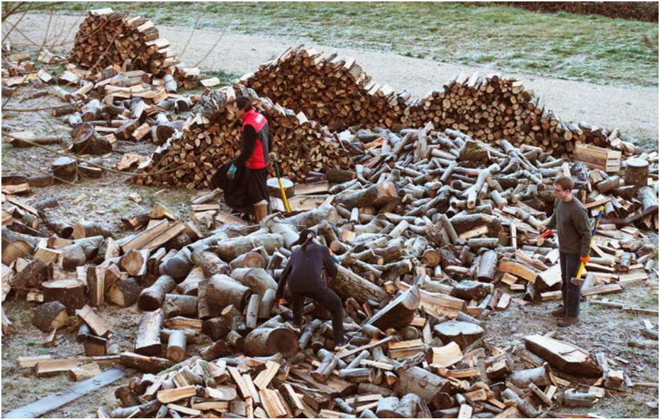
Un mercredi après-midi dédié à la fente du bois