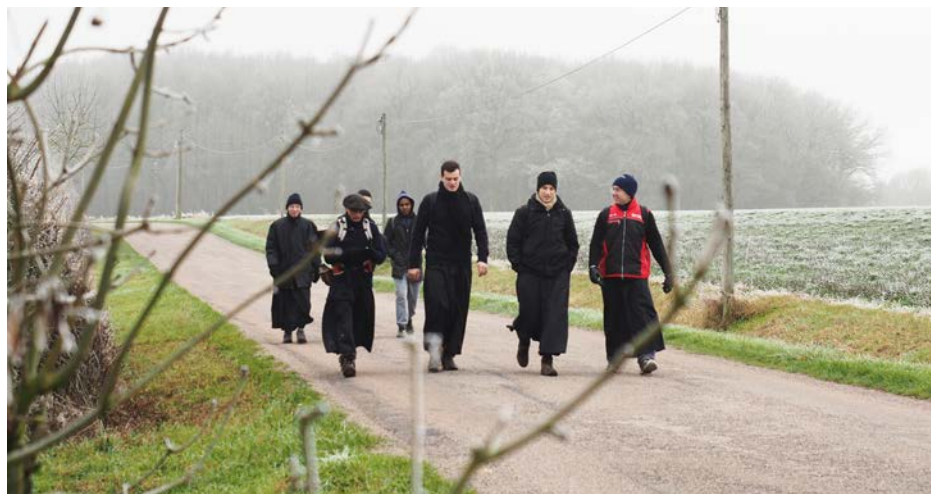
Sortie des frères pendant les vacances de Noël