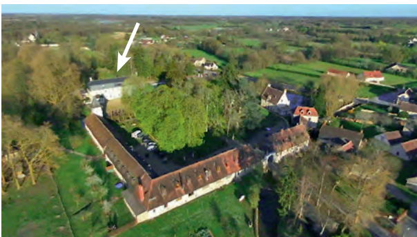
Vue aérienne de l'abbaye Saint-Michel. La mairie du village (flèche blanche) est sur l'emplacement du couvent primitif et de son abbatale.

Le roi conserva toutefois son palais (probablement à Mézières-en-Brenne), où il fit dresser un autel en attendant la construction d'une église pour les moines. Il l'enrichit de précieuses reliques, notamment d'un fragment de la vraie croix, d'un morceau de la robe de la Vierge et d'une partie du menton de saint Jean Baptiste.