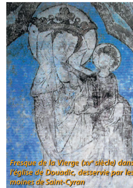
Fresque de la Vierge (XV e siècle) dans l'église de Douadic, desservie par les moines de Saint-Cyran

Au début du XVII e siècle, l'abbaye de St-Cyran acquit une notoriété dont elle se serait bien gardée. Le 25 e abbé commendataire, Mgr de la Roche-posay, évêque de Poitiers, était trop absorbé par ses activités diocésaines pour relever ce monastère menacé de ruine par la négligence des prieurs. Il confia donc l'abbatit à un prêtre originaire de Bayonne, qui, dans un de ses écrits, avait loué hautement son offensive épiscopale contre les protestants. Ce prêtre, récemment arrivé à Poitiers pour y trouver un soutien à ses idées, à la vérité peu orthodoxes, se nommait M. Duvergier de Hauranne. Nous reparlerons de ce personnage, plus connu sous le nom d'abbé de St-Cyran, ainsi que de la nocivité du jansénisme, dont il sera le chef de file.