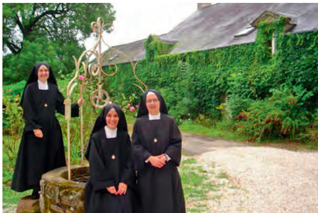
La communauté de Vannes devant sa future maison

SI VOUS DESIREZ AIDER LES SŒURS, vous pouvez envoyer votre correspondance aux :