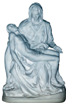
Notre-Dame de Compassion, Priez pour nous