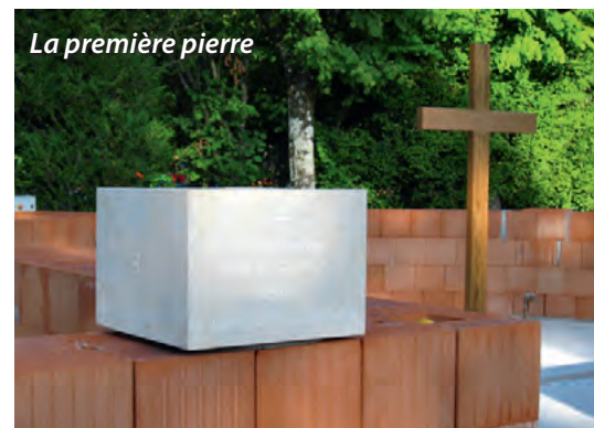
La première pierre

plus belle que nous n'avons pu la faire. Dans cet univers immense où son auteur a mis tant de variétés, n'est-il pas du devoir de l'homme de choisir pour la seule gloire de Dieu ce qui s'y trouve de plus précieux, en y employant son intelligence, son instinct du beau, le labeur de son esprit et de ses mains, toutes choses dont Dieu même l'a pourvu, seul de