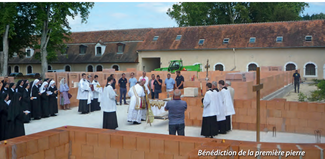
Bénédictio de la première pierre

Mais elle n'est cela que secondairement; premièrement, elle est la Maison de Dieu, elle est l'abri du Saint-Sacrement, et surtout elle est le lieu du Sacrifice seul digne de la gloire divine. N'existât-elle que pour Dieu seul (ce qui est impossible, car il est impossible d'aimer Dieu sans aimer son prochain) ce serait encore trop peu pour elle d'être mille fois