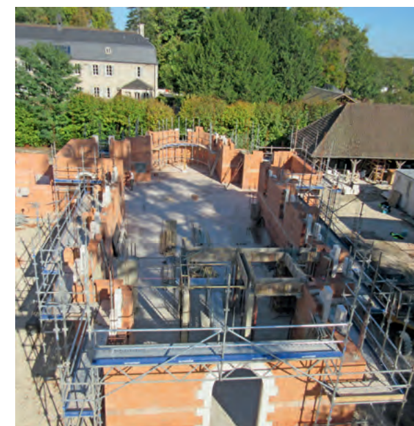
Octobre 2018, l'avancée des travaux