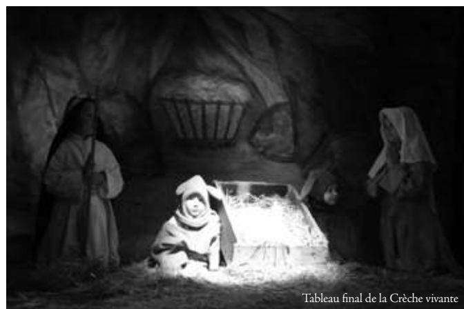
Tableau final de la Crèche vivante