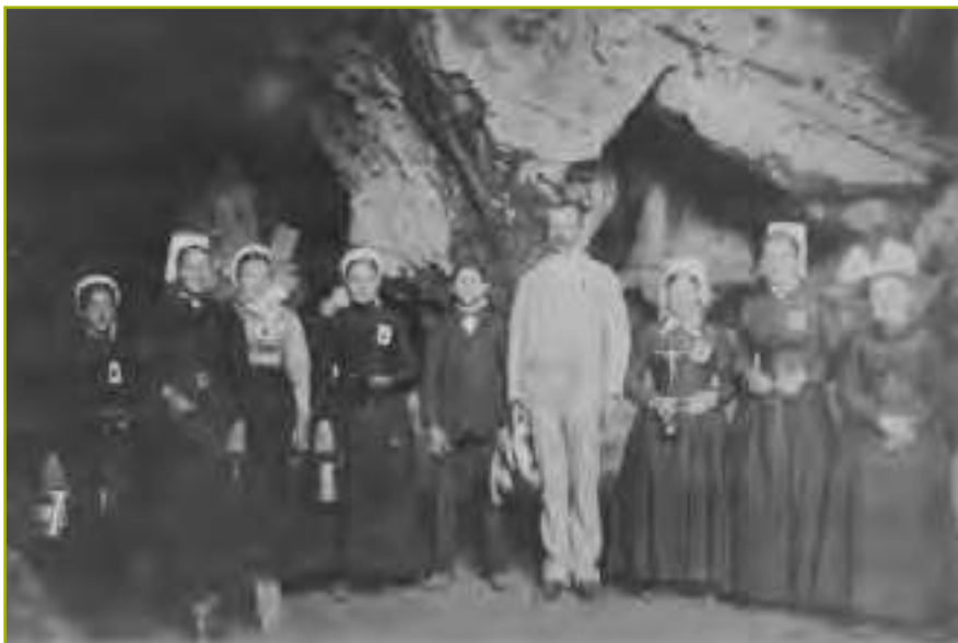
Un groupe de vendéens à Lourdes (précisément dans la grotte des Espéluques située après la dernière station du chemin de croix) au tout début du XX e siècle

Le 29 septembre 1912, le curé de Saint-Hilaire-de-Voust qui avait assisté sa jeune paroissienne dans sa maladie et sa longue agonie, écrivait à son évêque que cette guérison subite et stupéfiante était intervenue à la fin d'une neuvaine à