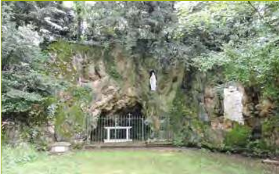
La reproduction de la grotte de Lourdes dans le domaine des Ursulines de Jésus à Chavagnes-en-Paillers.

Elle se trouve à Chavagnes-en-Paillers dans le domaine des Ursulines de Jésus. Un certain nombre de religieuses de cette congrégation, parmi lesquelles la supérieure, participaient au pèlerinage de septembre 1872. À leur retour, la décision fut prise de reconstituer la Grotte auprès de leur maison mère. La communauté disposait là d'un site très favorable. Une haute paroi rocheuse rappelait celle de Lourdes. À proximité, la Petite Maine pouvait opportunément figurer un Gave de Pau qui, une fois descendu des Pyrénées, aurait ralenti son cours. Le terrassement fut entrepris en mai 1874, et voici qu'une source inconnue fut découverte du même côté qu'à Lourdes ! Des rocailliers de Nantes vinrent prolonger l'excavation pratiquée dans le rocher et donner à l'ouvrage son aspect définitif.