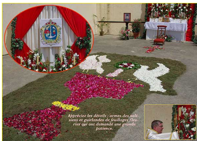
Appréz les détails : armes des salésiens et guirlandes de feuillages fleuries qui ont demandé une grande patience.