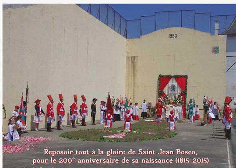
Reposoir tout à la gloire de Saint Jean Bosco, pour le 200° anniversaire de sa naissance (1815-2015)