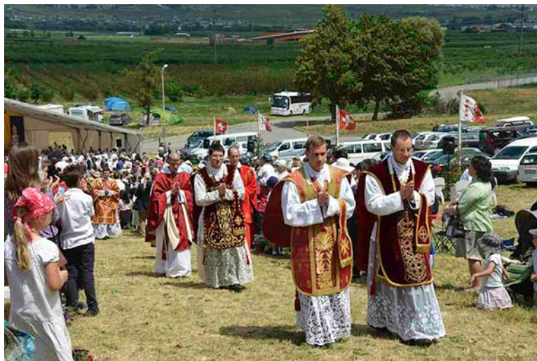
Les photos des premières bénédiction des jeunes prêtres