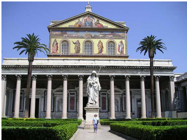
Puis Saint-Paul hors les murs, lieu de sa sépulture dans la nécropole de la Via Ostiense.