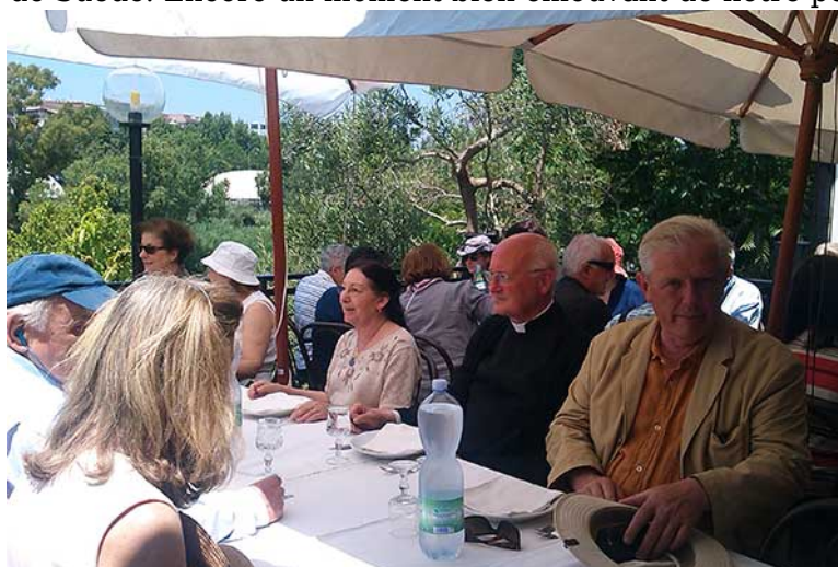
Mais après la matinée chargée, la pause s'impose ! Et qui plus est dans un endroit sympathique au bord de Tibre, en terrasse pour profiter du beau temps.