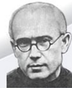
La Militia Immaculatae (MI) est le patrimoine de Saint-Maximilien Kolbe.

« L'Immaculée est notre idéal ! lui appartenir, inconditionnellement, la rayonner autour de nous, qu'elle règne dans tous les cœurs, c'est notre idéal et il coûte cher ! »