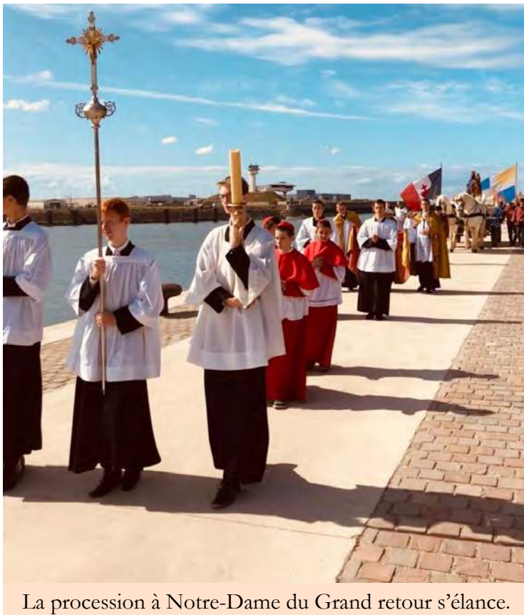
La procession à Notre-Dame du Grand retour s'élançe.

toute l'ordonnance de l'école, personnel, programmes et livres, en tout genre de discipline, soient régis par un esprit vraiment chrétien sous la direction et la maternelle vigilance de l'Église, de telle façon que la religion soit le fondement et le couronnement de tout l'enseignement, à tous les degrés, non seulement élémentaire, mais moyen et supérieur : " Il est indispensable, pour reprendre les paroles de Léon XIII, que non seulement à certaines heures la religion soit enseignée aux jeunes gens, mais que tout le reste de la formation soit imprégné de piété chrétienne. Sans cela, si ce souffle sacré ne pénètre pas et ne réchauffe pas l'esprit des maîtres et des disciples, la science, quelle qu'elle soit, sera de bien peu de profit ; souvent même il n'en résultera que des dommages sérieux " ».