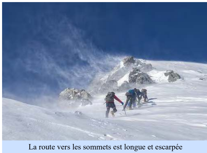
La route vers les sommets est longue et escarpée

Tout d'abord, se souvenir que la persévérance est un don de Dieu, qui s'obtient par la prière. Nous devons donc le demander avec instance, en union avec Celui qui a été constant jusqu'à la mort, et par