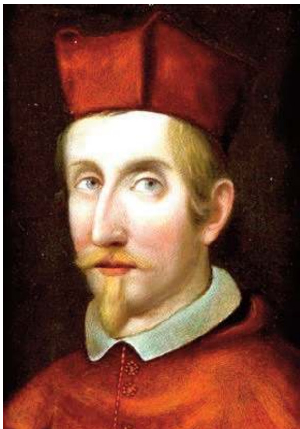
Cardinal Francesco Barberini

riche, on ne le revit plus. L'Institut ressentit longtemps dans les pays exploités le coup de cet invraisemblable imbroglio.