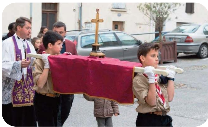
Chemin de Croix en Avignon

Fidèlement présentes au chemin de Croix en Avignon, les louvettes ont profité de leur dernière activité pour contempler les étoiles. Le samedi 16 Avril, après une matinée réservée aux jeux, épreuves et chants, Akéla avait réservé une surprise ! Ce sera un après-midi, observatoire ! En effet, les louvettes ont pu apprendre les constellations et autres galaxies au planétarium du Parc Longchamp à Marseille. Une louvette se doit de bien connaître la nature, création du Bon Dieu ... raison de plus ! Cet après-midi restera dans les mémoires.