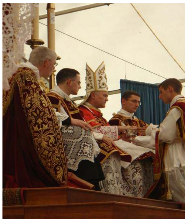
Tradition des instruments