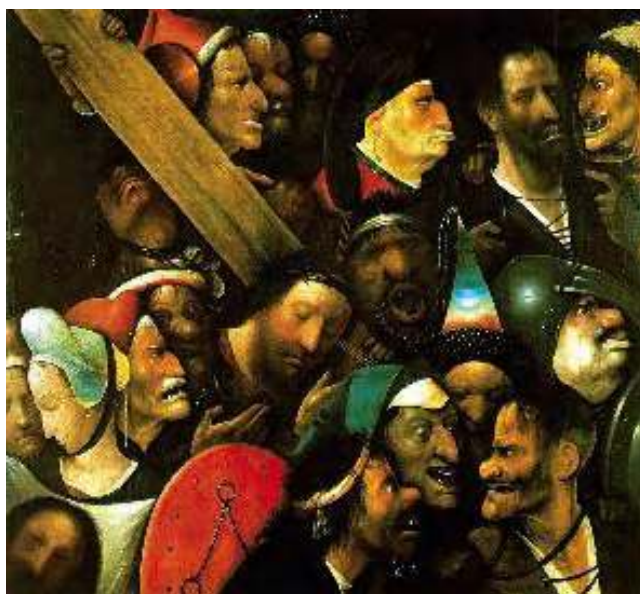
Jérôme Bosch : Chemin de croix

Soyons donc clairs, en ces circonstances: parlons de « morale » et arrêtons de parler d'« éthique », mettons en première place les droits de Dieu, défendons les seuls véritables « droits de l'homme »: ceux définis par les commandements de Dieu, qui seuls garantissent qu'une société politique puisse demeurer humaine ■