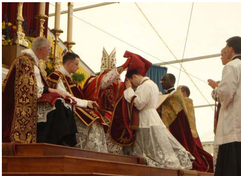
Imposition de la chasuble