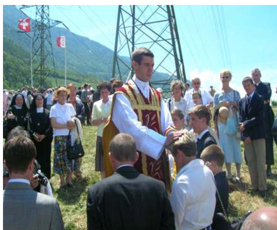
Sa première bénédiction