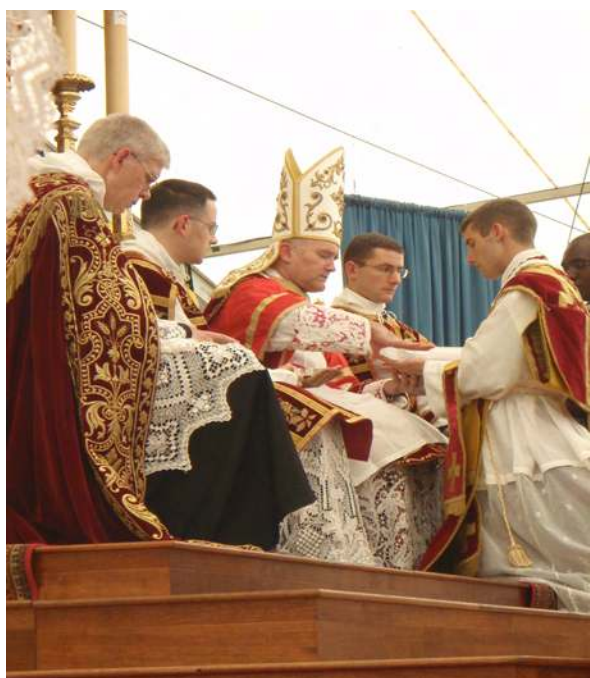
Consécration des mains