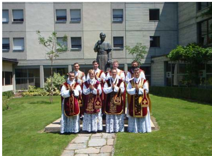
Huit nouveaux prêtres pour l'Église