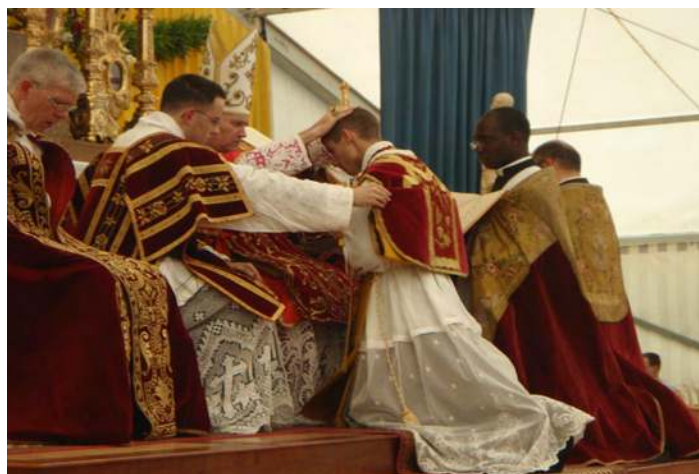
Le jeune prêtre reçoit le pouvoir de confesser