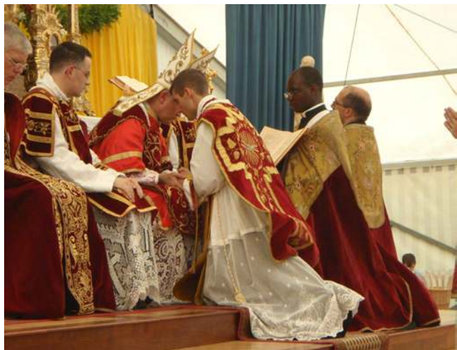
Il promet obéissance