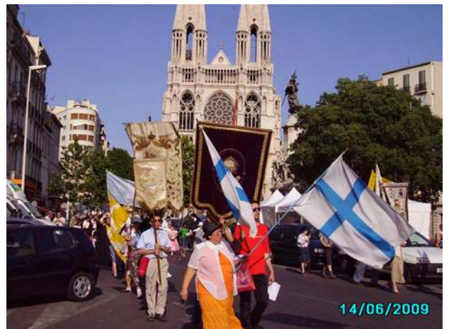
Bannières et drapeaux déployés la tête de la procession descend l'allée Gambetta

Nous étions près de 500 à participer à la procession du Saint-Sacrement le 14 juin dernier, dans les rues de Marseille.