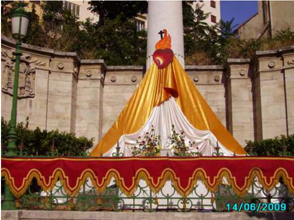
Le reposoir appuyé sur la colonne de la Vierge Dorée

de ferveur, non pas parce que nous étions plus fervents, mais grâce à une panne de sonorisation.