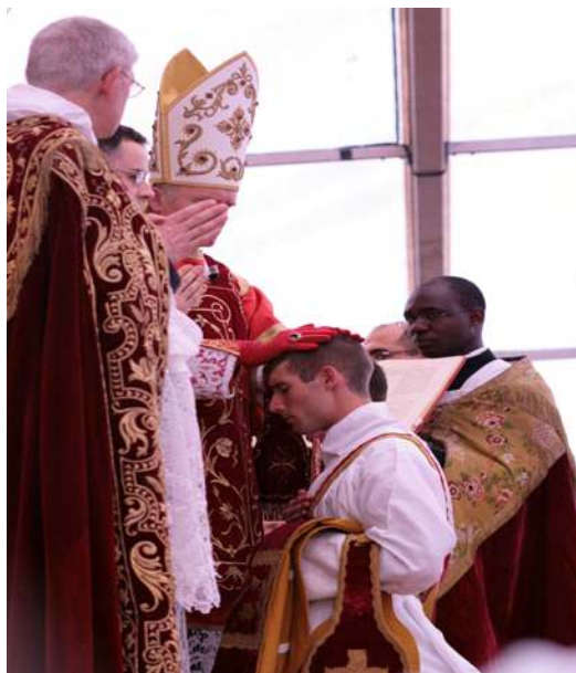
Imposition des mains