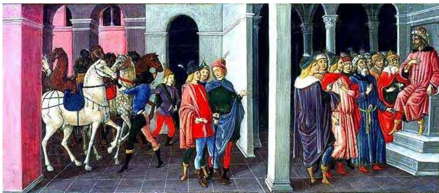
HERODE RECEVANT LES ROIS MAGES

Ne jugiez-vous de l'avenir par le passé ? Pourquoi donc toutes ces choses ne vous faisaient-elles pas conclure en vous-même, que ce n'était point-là l'ouvrage de la tromperie des Mages, mais de la puissance de Dieu, qui conduisait tout avec une admirable sagesse ?