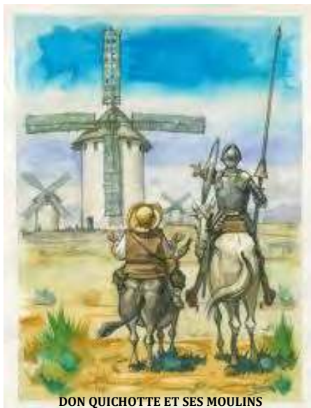
DON QUICHOTTE ET SES MOULINS

Janvier : M. Pantouflard flotte sur le petit nuage de la dévotion éclairée et fervente.