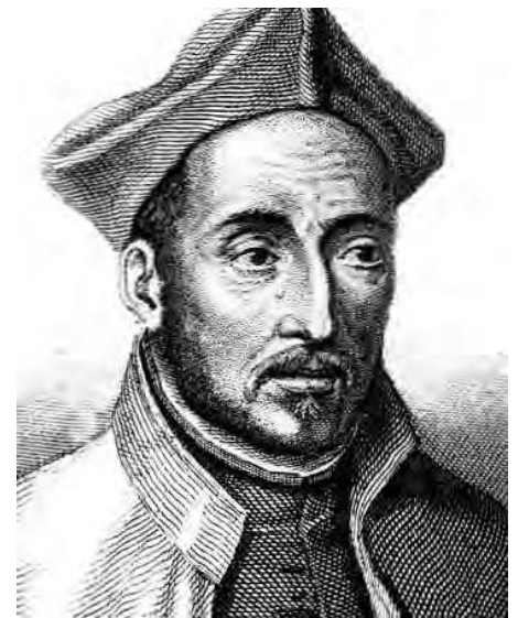
SAINT IGNACE, MAITRE DE L'ASCETISME

Las ! L'année s'écoule, le progrès n'est pas au rendez-vous. M. Pantouflard erre entre la désolation et l'indifférence face aux grands projets forgés dans la ferveur de la retraite. Que s'est-il passé ? Où est passé son enthousiasme ? Bien sûr, la solution la plus radicale serait pour lui de retourner faire une retraite. Mais il ne serait déjà pas inutile de revenir sur les causes de ce déclin.