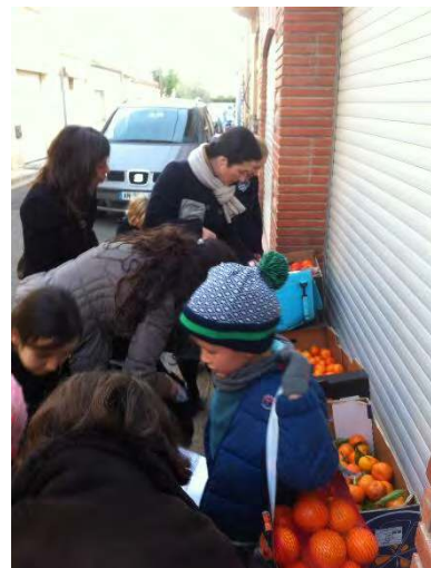
ECOLE PERPIGNAN DON MASSIF D'ORANGES POUR LES FAMILLES