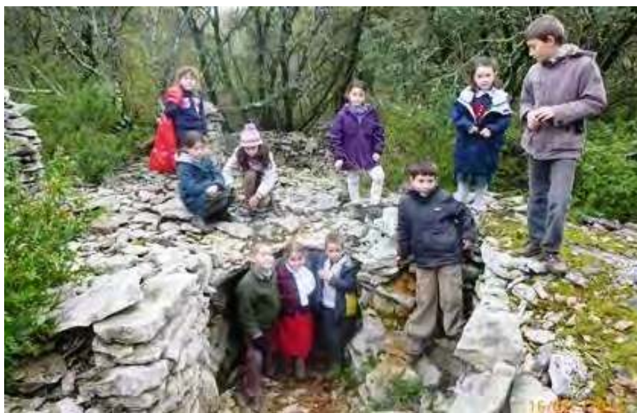
ECOLE DE FABREGUES : RANDONNEE PEDESTRE LORS DE LA SORTIE NATURE DU 16 DECEMBRE...