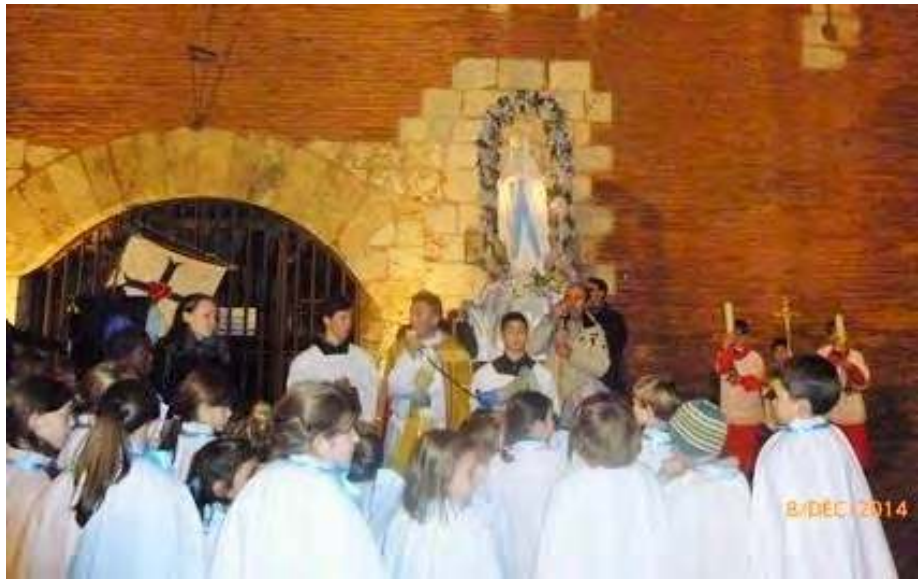
PROCESSION DU 8 DECEMBRE A PERPIGNAN : LES ENFANTS DE L'ECOLE ONT REVETU LA CAPE BLANCHE

A Fabrègues, une semaine plus tard, la salle Saint François prend peu à peu l'aspect d'une caverne d'Ali Baba ! Le lendemain, dimanche 7 décembre, nos fidèles n'eurent aucune peine à y pénétrer