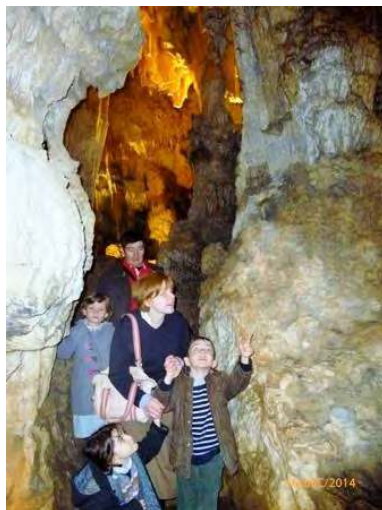
... ET D'ADMIRER LA GROTTTE DES DEMOISELLES !