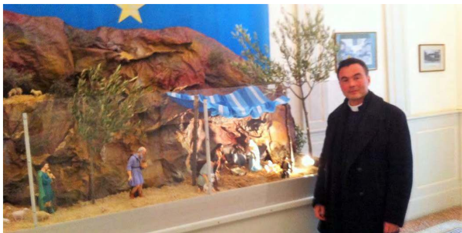
LA CRECHE DE BEZIERS : GLORIA IN EXCELSIS DEO !