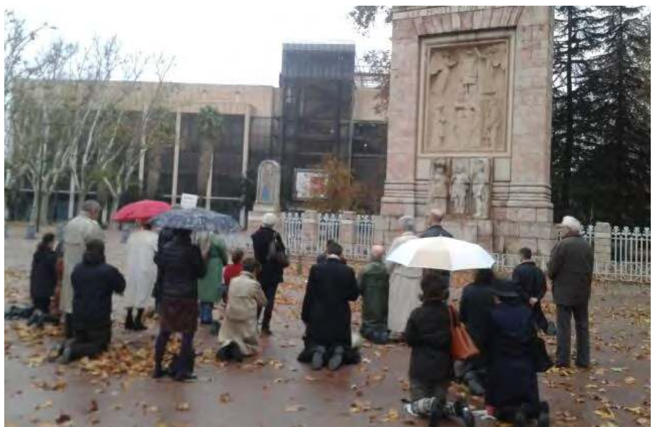
ROSAIRE POUR LA VIE A PERPIGNAN : LA PLUIE, PEU HABITUELLE, AURAIT-ELLE FAIT FUIR LES MOINS COURAGEUX ?