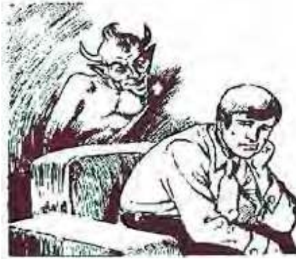
LE DEMON SOUFFLANT A L'OREILLE DU CHRETIEN

Juillet : M. Pantouflard boude. Il a voulu consulter ses proches pour savoir quels étaient ses défauts et a eu des surprises désagréables. Il lui faut un peu de temps pour digérer ces révélations. Occasion, peut-être, de décider d'accepter les remarques humiliantes avec bonne humeur... ?