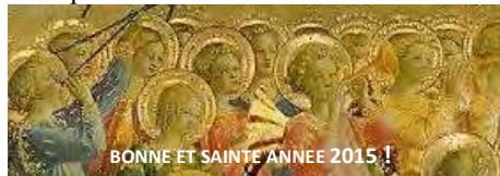
BONNE ET SAINTE ANNEE 2015 !