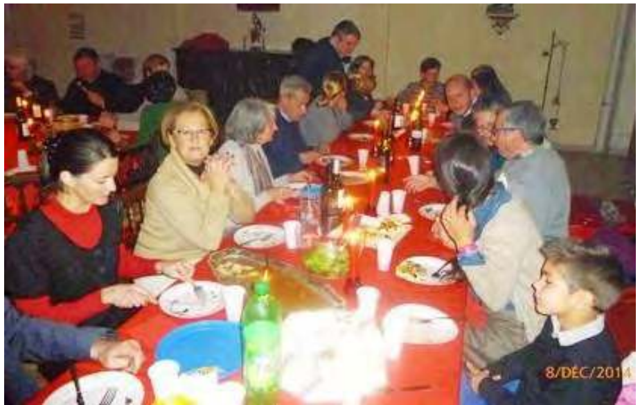
PERPIGNAN : REPAS DE FETE POUR L'IMMACULEE CONCEPTION