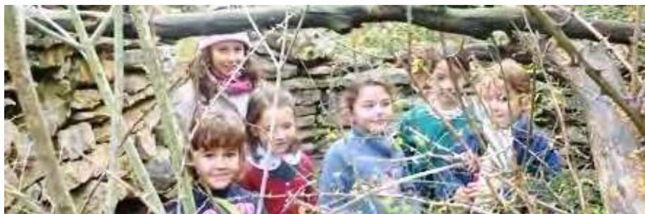
... QUI PERMET DE DECOUVRIR DES CACHETTES EMPLIES DE POESIE...