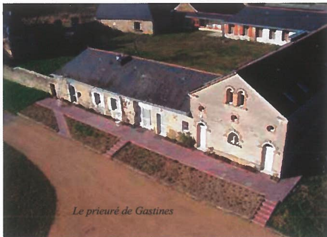
Le prieuré de Gastines

Monseigneur Lefebvre Conférence aux sœurs, 1986