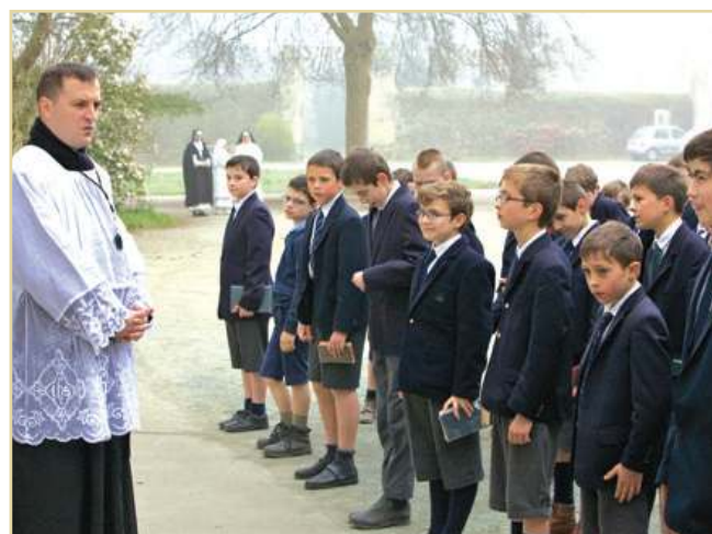
Juste avant la messe, le rassemblement avec les missels

Merci d'adresser vos dons à AEP SAINT-MARTIN, La Placelière, 44690 Château-Thébaud. Sur simple demande de votre part, nous vous adresserons un reçu fiscal.