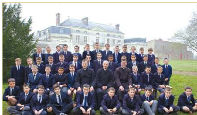
Les élèves de l'école Saint Martin, photo souvenir de la bénédiction de l'école le 17 mars 2014

et grâce à vous. L'école soutient vos familles, vos familles soutiennent notre école, il y a cet échange tout simple et merveilleux à la fois qui explique aussi l'esprit de corps qui se met en place à Saint-Martin.