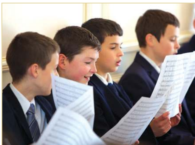
Répétition de chant avant la messe