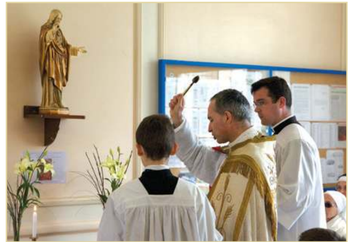
Intronisation du Sacré Cœur de Jésus dans le hall d'honneur de l'école

Nous voici désormais engagés dans la réhabilitation de la 2 ème partie du bâtiment