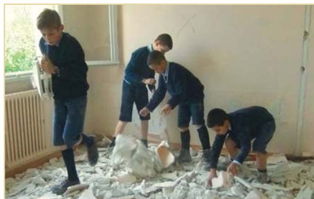
Démolition et démontage de la partie hôpital

reste plus que le tiers de la somme à réunir. Mais ce n'est pas rien. C'est pourquoi nous comptons toujours sur votre générosité pour nous permettre de mener à bien cette opération : tout doit être prêt pour la visite de sécurité prévue au début de l'été !