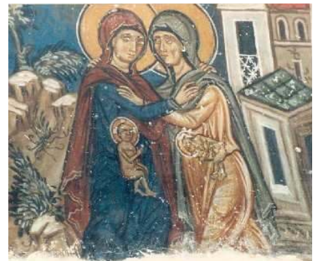
Pelendri, Chypre, église Ste Croix (XIV e s.)

recours aux hybrides, permet de contourner la difficulté liée à la stimulation ovarienne mais "la présence de l'ADN cytoplasmique augmente les risques de rejet et rend peu probable l'utilisation thérapeutique des cellules provenant des clones hybrides (...)" ■