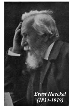
Ernst Haeckel (1834-1919)