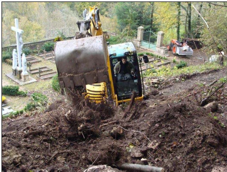
Nouvel accès au cimetière