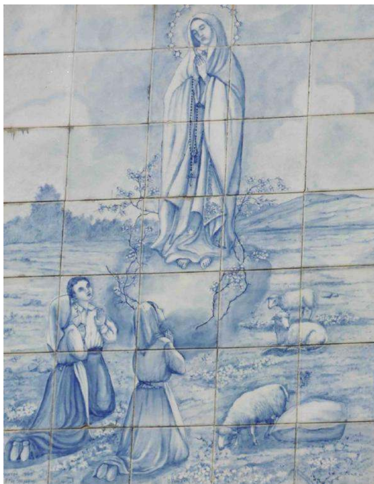
Azulejo de l'apparition de ND de Fatima, Place du village de São Pedro de Rates