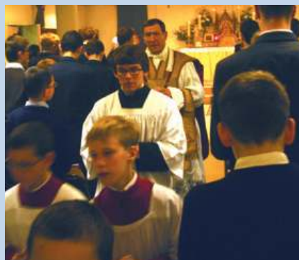
Procession de sortie

Nous devons souligner les différences, parce que l'un des vices de notre temps est de rechercher la simplification dans l'uniformité.