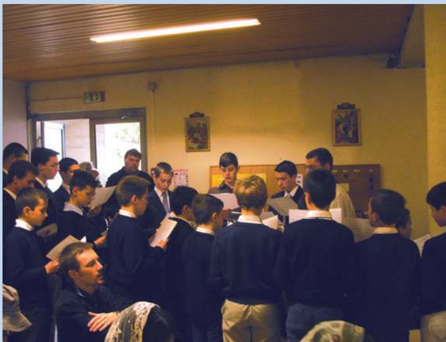
La Chorale pendant la messe

► physiquement comme celui de déménageur, de légionnaire ou de pompier sont spécifiquement masculins, parce que les hommes sont plus forts que les femmes sur le plan physique. A l'inverse, la maternité est réservée à la femme, et tous les métiers qui s'y rapportent sont mieux pratiqués par les femmes, parce que le soin des petits enfants demande tendresse, intuition et sensibilité, domaines dans lesquels les femmes sont supérieures aux hommes. Pensons par exemple aux sages-femmes et aux puéricultrices. Remarquons aussi qu'il y a davantage d'institutrices que d'instituteurs, surtout en maternelle et en CP.