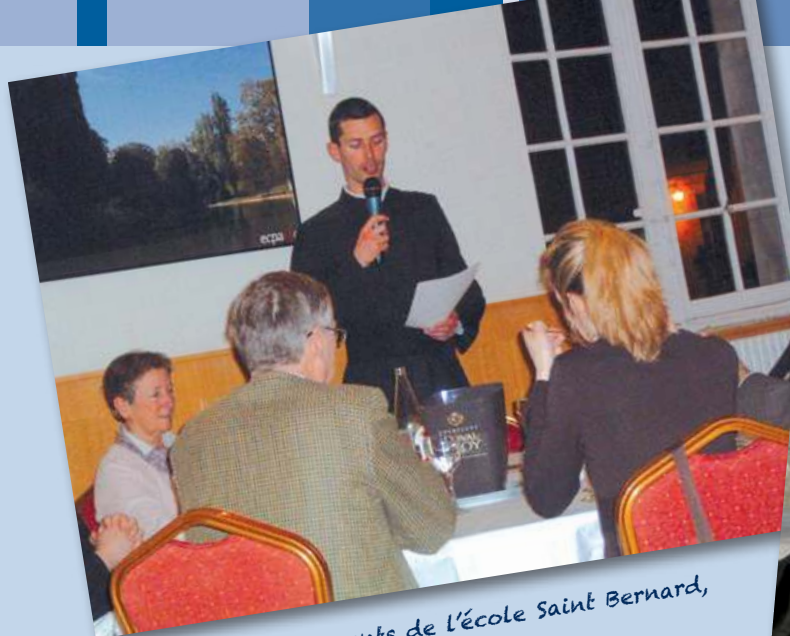
▲ Repas des parents de l'école Saint Bernard, primaire et secondaire

Nous faisons appel à votre générosité tout particulièrement en vue de nos travaux de peinture et d'entretien des salles de classe qui auront lieu l'été prochain.