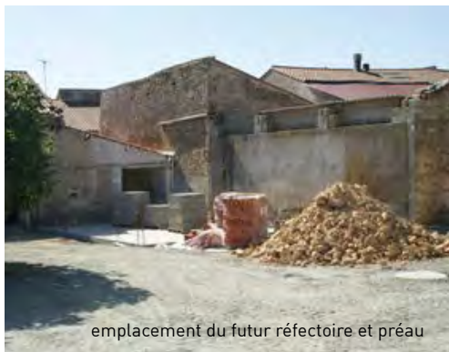
emplacement du futur réfectoire et préau

Les enfants aiment les grosses tranches de gâteaux, les entreprises les grosses tranches de travaux. Nos entreprises furent bien servies à l'école cet été, car la tranche fut si épaisse qu'il en reste encore aujourd'hui puisque la nouvelle chaudière n'est pas encore installée et qu'on y supplée par des chauffages d'appoint. Cependant nous pouvons déjà commencer à remercier tous ceux qui nous ont aidé. Nommons d'abord : l'entreprise de travaux publics qui creusa la cour et l'étable pour des fondations et différents réseaux. Heureusement qu'à la fin, elle transforma les tranchées en cour de récréation, en rajoutant du 20-40, qu'il ne faut pas confondre avec le 421 ou le 14-18.