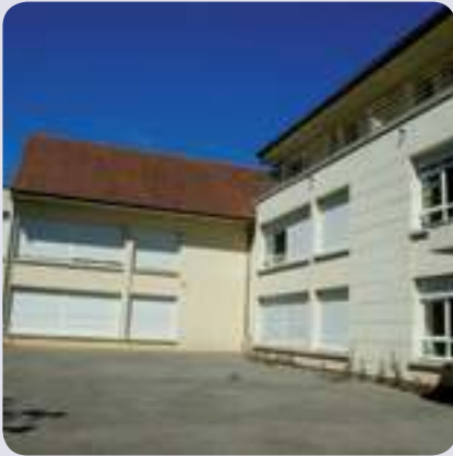
Des locaux tout neufs qui n'attendent que leurs élèves.