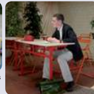
Plus vrai que nature !