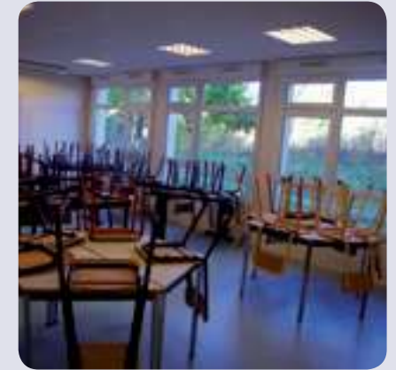
Pour recevoir tous les élèves, le réfectoire sera agrandi en sacrifiant deux salles de classe inutilisées.