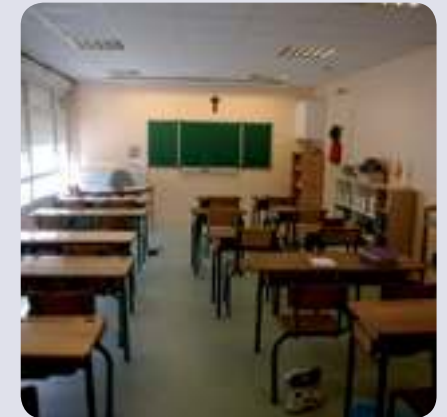
Pour accueillir nos élèves actuels et les nouveaux ...