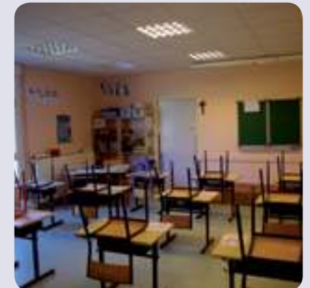
... les classes sont en nombre suffisant !