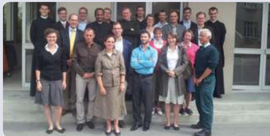
Le nouveau corps professoral pour la rentrée 2012.