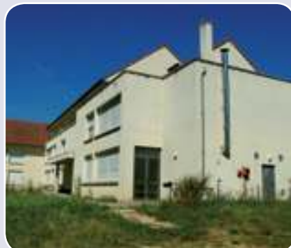
L'école vue depuis la cour de récréation.

Si vous désirez découvrir cette nouvelle école, je vous invite à Bailly, 5 rue de Chaponval, le samedi 24 novembre, pour la vente de Noël.