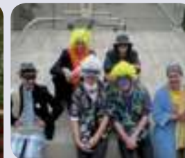
Le dernier jour de cours, les Terminales proposent une nouvelle tenue d'école !