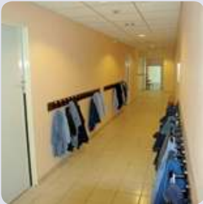
Les couloirs s'ouvrent de plain-pied sur les classes.