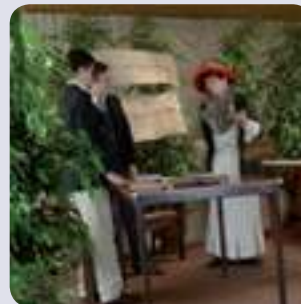
Les quatrièmes assurent le spectacle.