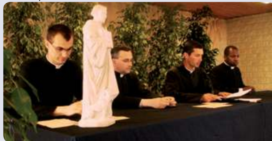
La distribution des prix sous la protection de Saint-Bernard.