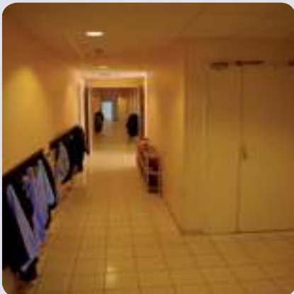
Aux heures de cours aucun cancre en vue dans les locaux vastes et aérés !