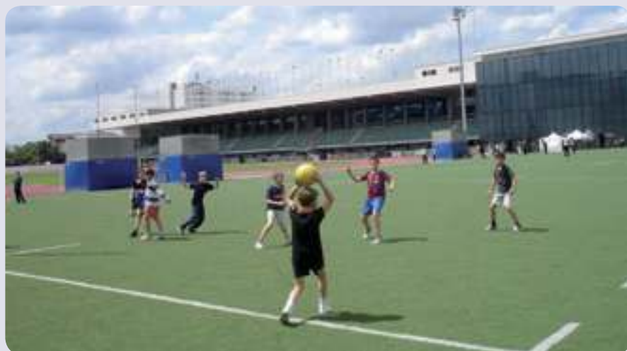
Les terrains de sport ne sont pas si petits à Saint-Bernard !