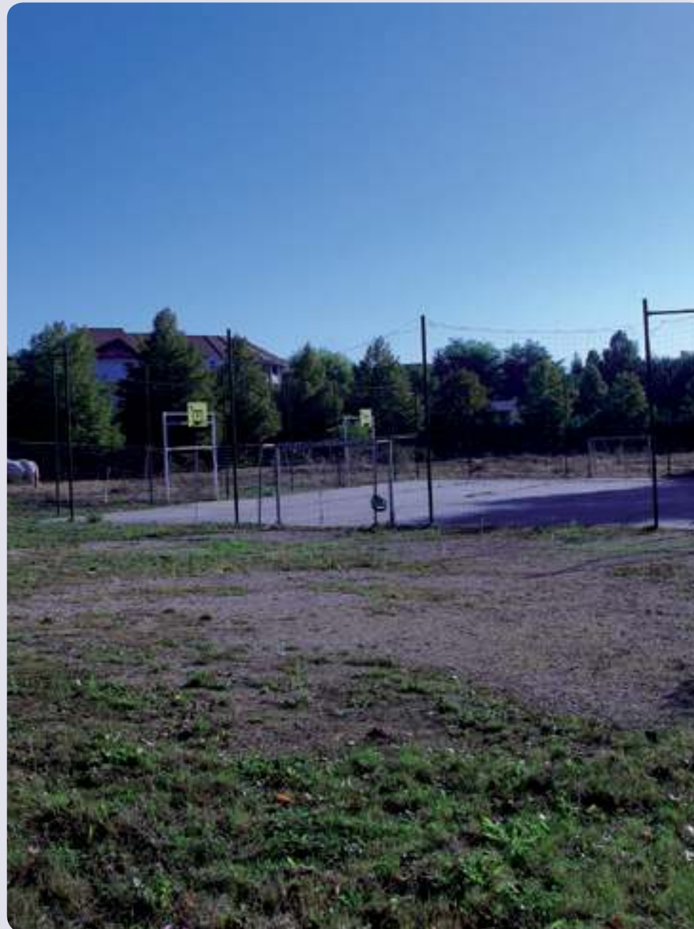
La cour de récréation...Un peu plus vaste !