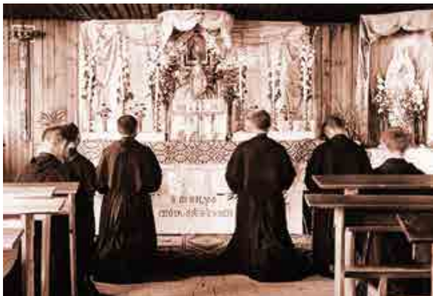
La première chapelle à Niepokalanów

En 1930, le P. Kolbe fonda une deuxième « Cité de l'Immaculée » à Nagasaki, au Japon, qui fut miraculeusement épargnée par le bombardement atomique de la ville en 1945. Au début des années 1960, la M.I. comptait 500 filiales sur les cinq continents et était forte de plus de trois millions de membres.