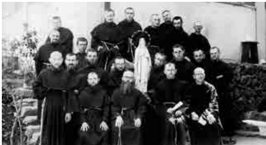
A mugenzai no seibo no sono, Japon.

médiatique avait démarré avec deux frères religieux et il diffusait une lettre d'information d'un tirage de 5000 exemplaires. En 1939, à la veille de la Seconde Guerre Mondiale, la communauté religieuse forte de 762 moines faisaient fonctionner une gigantesque maison d'édition