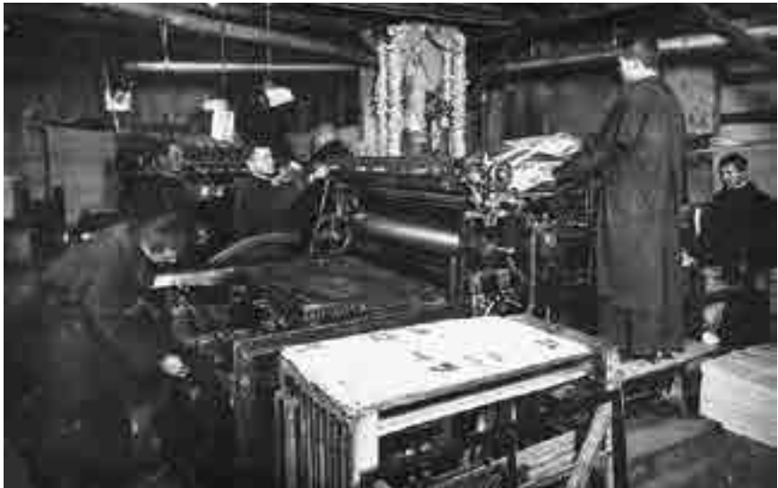
Presse à imprimer, Niepokalanów.

En 1922, il publia le premier numéro du Chevalier de l'Immaculée. Les coûts furent couverts par des fonds récoltés par la mendicité. De 1922 à 1927 il était basé, avec sa petite presse à imprimer, dans le couvent de Grodno. A cause de la foule de vocations et l'expansion de l'apostolat de la presse, il quitta Grodno en 1927 et fonda Niepokalanów, la Cité de l'Immaculée, de laquelle il sera nommé supérieur jusqu'en 1930.