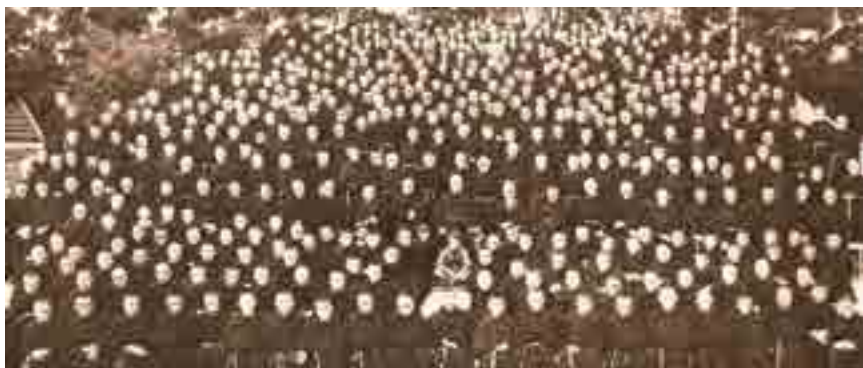
En 1922 ils n'étaient que 3. En 1927, lorsque la Cité de l'Immaculée fut construite, ils étaient 18 frères ; en 1939 ils étaient 762.

d'une communauté religieuse d'échelle locale ou au niveau d'un ordre religieux ou d'une congrégation. Des associations peuvent aussi être créées par des chevaliers qui partagent des centres d'intérêts spirituels, regroupés par âge ou objectifs apostoliques, etc. De plus, les organisations déjà existantes (i.e. mouvements de jeunesse, groupes d'études, etc.) peuvent embrasser l'idéal de la M.I. et fonctionner ainsi comme des groupes de second degré de la M.I.