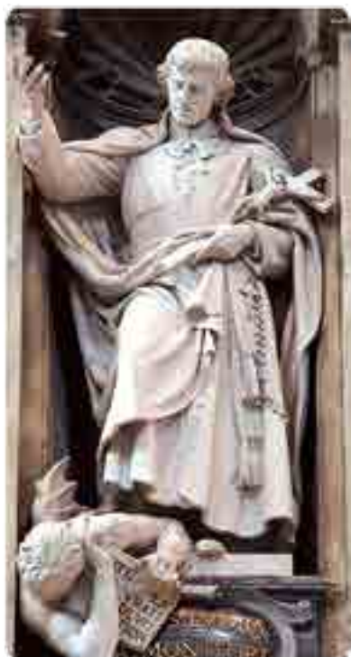
Saint Louis-Marie Grignon de Montfort, l'un des plus grands saints mariaux dont les écrits ont particulièrement inspirés Saint Maximilien.

lée ? » Le jeune frère religieux médita les saintes écritures, les pères de l'Église, les enseignements des grands saints mariaux comme, par exemple, ceux de Saint Louis-Marie Grignon de Montfort ; il médita également le dogme de l'Immaculée Conception, ainsi que le sens des apparitions de Notre Dame à Lourdes. En effet, toutes ces vérités et ces mystères n'ont pas seulement une signification spirituelle très élevée mais sont aussi porteurs d'une dimension extrêmement pratique en raison de leur pertinence sociale. « La Vierge sans tâche, victorieuse de toutes les hérésies, ne reculera pas devant l'ennemi qui relève la tête devant Elle. Lorsqu'Elle trouvera de fidèles serviteurs obéissant à Ses ordres, Elle remportera de nouvelles victoires, bien plus grandes que ce que nous pouvons imaginer. »