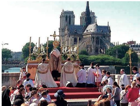
Le reposoir de la procession de la Fête-Dieu à Paris

En effet, la confusion règne : dans un couvent de l'Isère, pour la messe de l'Ascension, le prêtre a tout simplement... oublié ! Il est vrai qu'ils ne sont plus tenus de la célébrer tous les jours mais comment ne pas trouver cela monstrueux. Pour l'Ascension de Notre-Seigneur, les fidèles ayant fait, pour certains, des kilomètres, s'en sont retournés, bien vides et bien tristes.