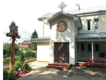
Le prieuré de Kaunas

Le 10 mai 1988, M gr Marcel Lefebvre donnant une superbe conférence aux jeunes et fervents prêtres de la FSSPX en France, déclara : « Le prieuré est la solution pour la préservation de la grâce de la prêtrise et la ferveur du prêtre. Le prieuré est comme une forteresse sur le terrain du combat... Si les prieurés étaient appelés à disparaître, alors la Fraternité ne durerait pas. C'en serait fini de notre Fraternité qui repose essentiellement sur ses prieurés et la vie de communauté, une vie protégée, une vie qui est, en quelque sorte cloîtrée et protégée du monde. »