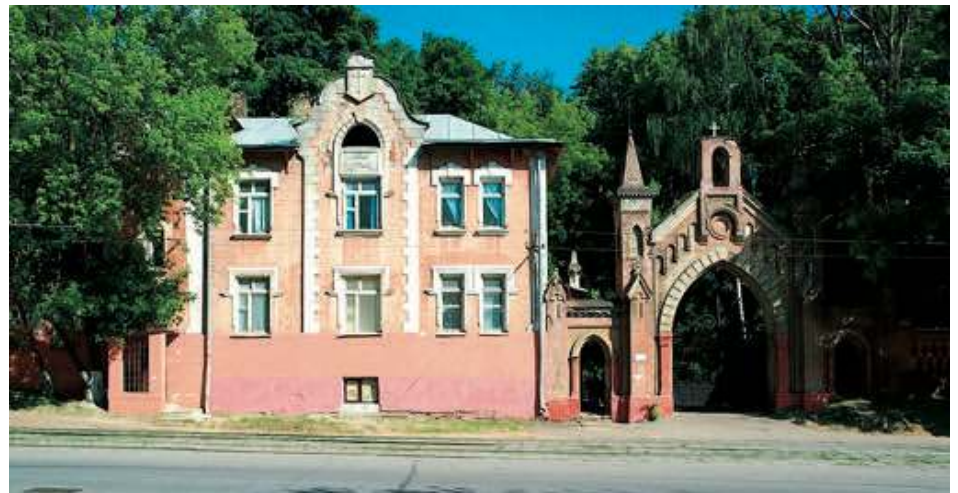
Chapelle du Cœur immaculé de Marie, Moscou

Les Occidentaux, notamment ceux qui connaissent peu l'histoire de la Russie, ne réalisent pas combien elle fut anticatholique.