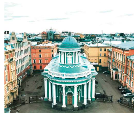
Chapelle Notre-Dame de Fatima Saint Pétersbourg

Le seul aspect positif est le prix peu élevé : 17.000 roubles par mois (225 €). Mais nos prêtres doivent continuer à descendre dans de petits hôtels. Comme pour se rendre à Moscou, ce sont de longs voyages pour atteindre cette superbe ville des Tsars ; je vous laisse imaginer toutes ces nouvelles dépenses.