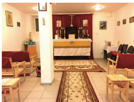
Moscou : l'intérieur de la chapelle

Alors, comment apporter en Russie l'œuvre de M gr Lefebvre qui préserve la Tradition catholique ? Et comment faire comprendre à des Russes anticatholiques l'actuelle crise de l'Église ? Comment expliquer qu'ils doivent se convertir au catholicisme mais que, en même temps, une crise terrible sévit dans l'Église catholique et que, de ce fait, ils doivent désobéir au pape et à l'Église et défendre la FSSPX et la Tradition ? Désobéir au pape ? Et ce ne serait pas le même que le russe orthodoxe ? Cela semblait impossible ! Confiant en Notre-Dame de Fatima, nous commençâmes l'impossible, et nous poursuivons.