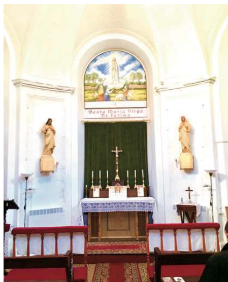
Saint Pétersbourg Intérieur de la chapelle

La Russie en est à un point très important et critique de son histoire. La société et la culture russes furent bâties au cours des siècles sur la religion orthodoxe et l'empire des Tsars, « la sainte Russie » comme ils l'appellent. Puis les communistes détruisirent complètement cette Russie et en créèrent une totalement nouvelle, matérialiste et athée. Ce fut un bouleversement complet en matière politique, religieuse et sociale, une expérience marxiste-léniniste entraînant une schizophrénie psychologique chez le pauvre peuple russe historiquement très religieux.