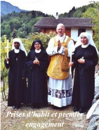
Prises d'habit et premier engagement

Lundi 1 er mai : Avant la récitation du chapelet devant le Saint-Sacrement exposé, toute la communauté est réunie devant la statue du Cœur Immaculé de Marie. Notre Dame a reçu aujourd'hui une place d'honneur dans notre jardin et après la bénédiction de Monsieur l'Aumônier, nous saluons la Reine du Ciel et de la terre par le chant polyphonique « Salve Regina caelitem ».