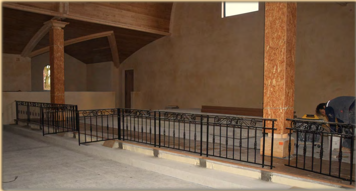
Pose de la table de communion