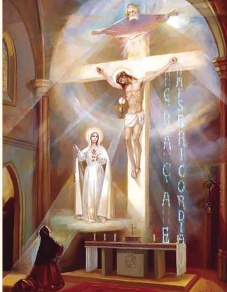
Vision de sœur Lucie, à Tuy, en 1929 :

„Très Sainte Trinité, Père, Fils et Saint-Esprit, je vous adore profondément et je vous offre les très précieux Corps, Sang, Âme et Divinité de Notre Seigneur Jésus-Christ, présents dans tous les tabernacles du monde, en réparation des outrages, sacrilèges et indifférences par lesquels il est Lui-même offensé. Par les mérites infinis de son Cœur Sacré et par ceux du Cœur Immaculé de Marie, je vous demande la conversion des pauvres pécheurs“.