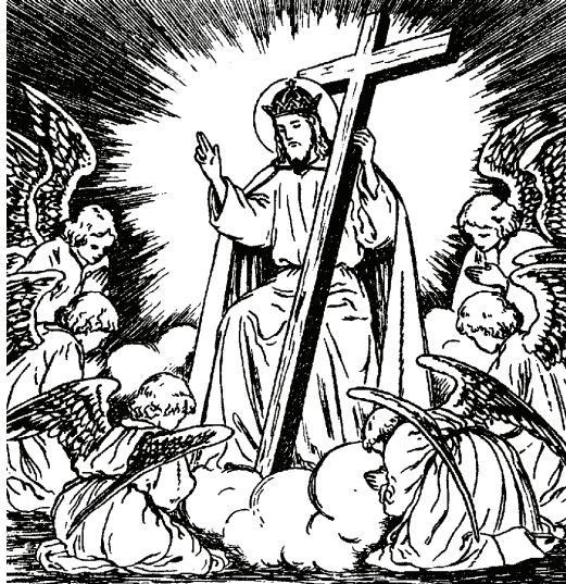
Jésus-Christ est Roi par sa naissance et par la conquête.

contre le catholicisme : «... devant la situation de l'Eglise aujourd'hui, nous avons le sentiment que par quelque fissure la fumée de Satan est entrée dans le peuple de Dieu... » dira le pape Paul VI dans son homélie du 29 juin 1972. Certains hommes de l'Eglise ont hélas démissionné de leur charge de vrai pasteur d'âmes, cherchant à « hurler avec les loups » selon l'expression de saint Pie X.