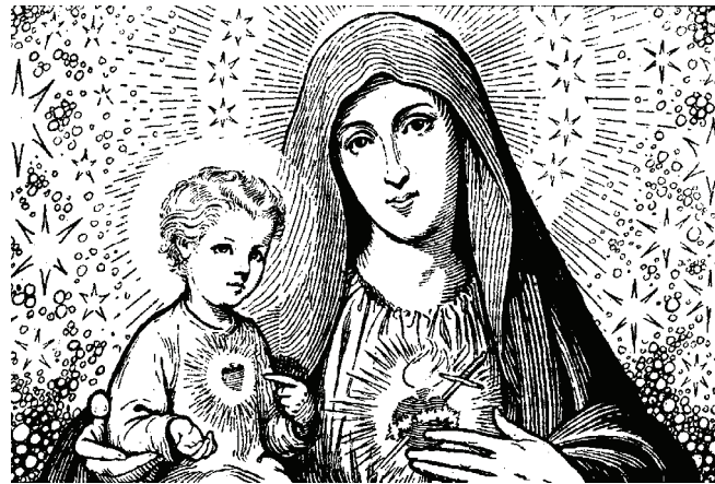
La divine Providence gouverne le monde par sa Sainte Mère

XII ont voulu renouveler l'hommage de leur piété à Notre-Dame de la Providence qu'on appelle également « Notre-Dame de bonne garde. » Des Saints et des Bienheureux ont placé leurs œuvres sous sa protection.