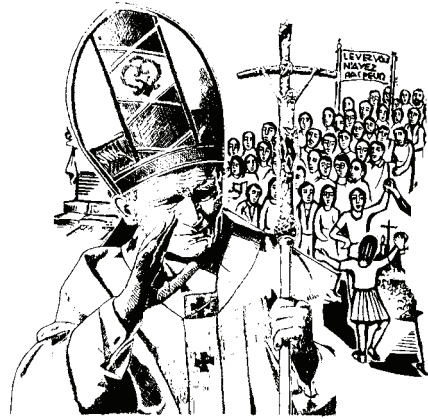
Jean-Paul II, le pape qui pratiqua l'œcuménisme, tuant l'élan missionnaire de l'Eglise.

lu saint Paul qui nous dit : « Ce que les païens sacrifient, ils l'offrent aux démons et non à Dieu » (I Cor, 10, 20) ? Les prières instituées par les fausses religions ne peuvent pas plaire à Dieu, car le Dieu que prient les infidèles n'est pas le Dieu qui s'est révélé, et le Christ que les hérétiques honorent ou adorent n'est pas le Christ que nous adorons (Quel est, en effet, ce « Jésus Christ » que les éveillés proclament si souvent, mais qui, selon eux, n'a pas fondé d'Eglise visible, ne se rend pas présent sur l'autel à la Messe, n'a pas institué de sacerdoce, et qui n'a, pour toute Liturgie, qu'une « louange » étrangement semblable aux concerts des fêtes profanes ? Ce Christ est-il Celui que prient les catholiques ? Nullement).