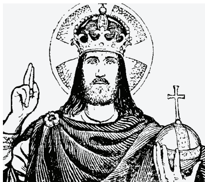
Jésus-Christ doit régner sur les pays.

obligatoire), comme chez les Protestants ; le prêtre est tourné vers les fidèles, comme chez les Protestants ; le tabernacle a disparu des autels, comme chez les Protestants ; il n'y a plus de genuflection pour adorer Jésus présent dans le sacrement de l'Eucharistie, comme chez les Protestants. On parle très peu des péchés qui nous ont rendus si misérables ; on a diminué les