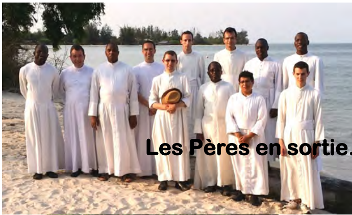
Les Pères en sortie... pose sourire!