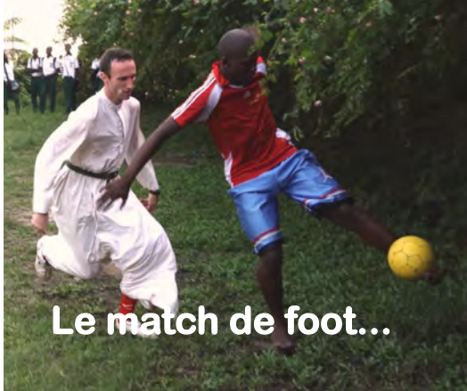
Le match de foot...