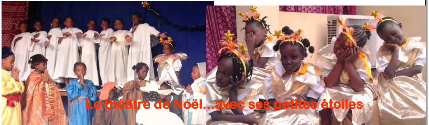
Le théâtre de Noël...avec ses petites étoiles