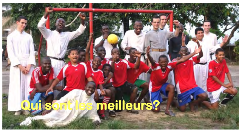
Qui sont les meilleurs?