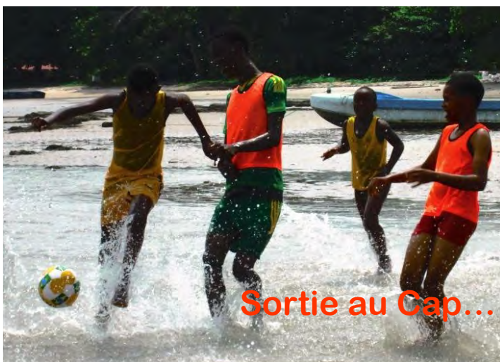
Sortie au Cap... attention à la vague!