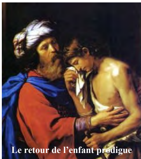
Le retour de l'enfant prodigue

-Et bien mon cher ami, il s'agit de bien voir tout ce qu'il faut accuser, et en particulier dans la confession tu dois accuser tous les péchés mortels pas encore confessés, ainsi que leur nombre et ce qui peut les rendre plus graves. Il est bon d'accuser aussi les péchés véniels. Et cela ne suffit pas