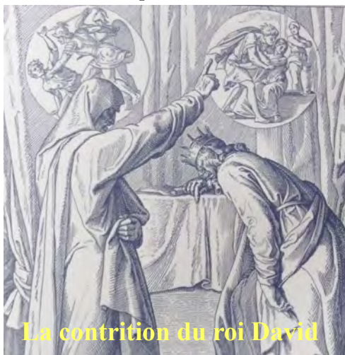
La contrition du roi David

Cette douleur doit avoir quatre qualités. Premièrement, elle doit être intérieure , c'est-à-dire vient du fond du cœur. Elle ne consiste pas dans les larmes ; elles sont bonnes et utiles, il est vrai, mais elles ne sont pas nécessaires. Deuxièmement elle doit être surnaturelle , c'est-à-dire, qu'elle doit être excitée