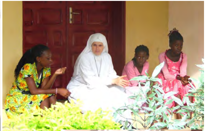
La Compagnie de l'Immaculée: conduire les âmes à Jésus par Marie!